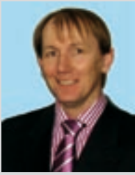
Harm-Uwe Weber, Erster Kreisrat