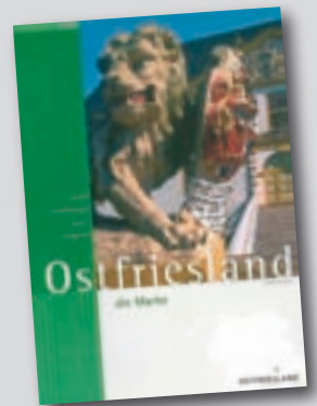
Gemeinsame Anstrengungen, die Dachmarke Ostfriesland bekannter zu machen.

Bei der Innovationsberatung arbeitet die Wirtschaftsförderung eng mit der nevis Beratung aus Oldenburg zusammen. In den vergangenen Jahren hat sich die Vermittlung von Kontakten zwischen Wirtschaft und Wissenschaft durch „Technologie- bzw. Innovations-