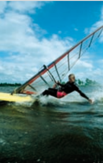
Surfen auf dem Großen Meer