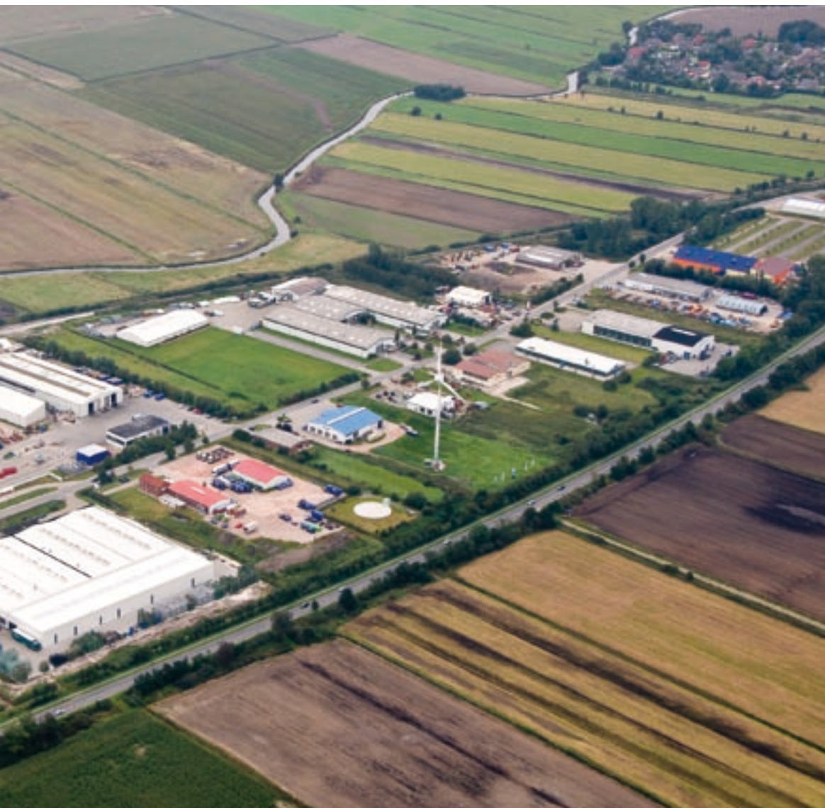
Gewerbegebiet der Gemeinde Südbrookmerland in Georgsheil