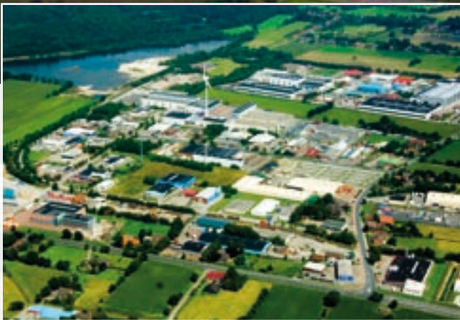
Industrie- und Gewerbe- gebiet der Stadt Aurich in Sandhorst