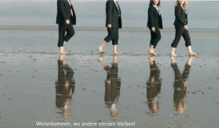
Weiterkommen, wo andere stecken bleiben!