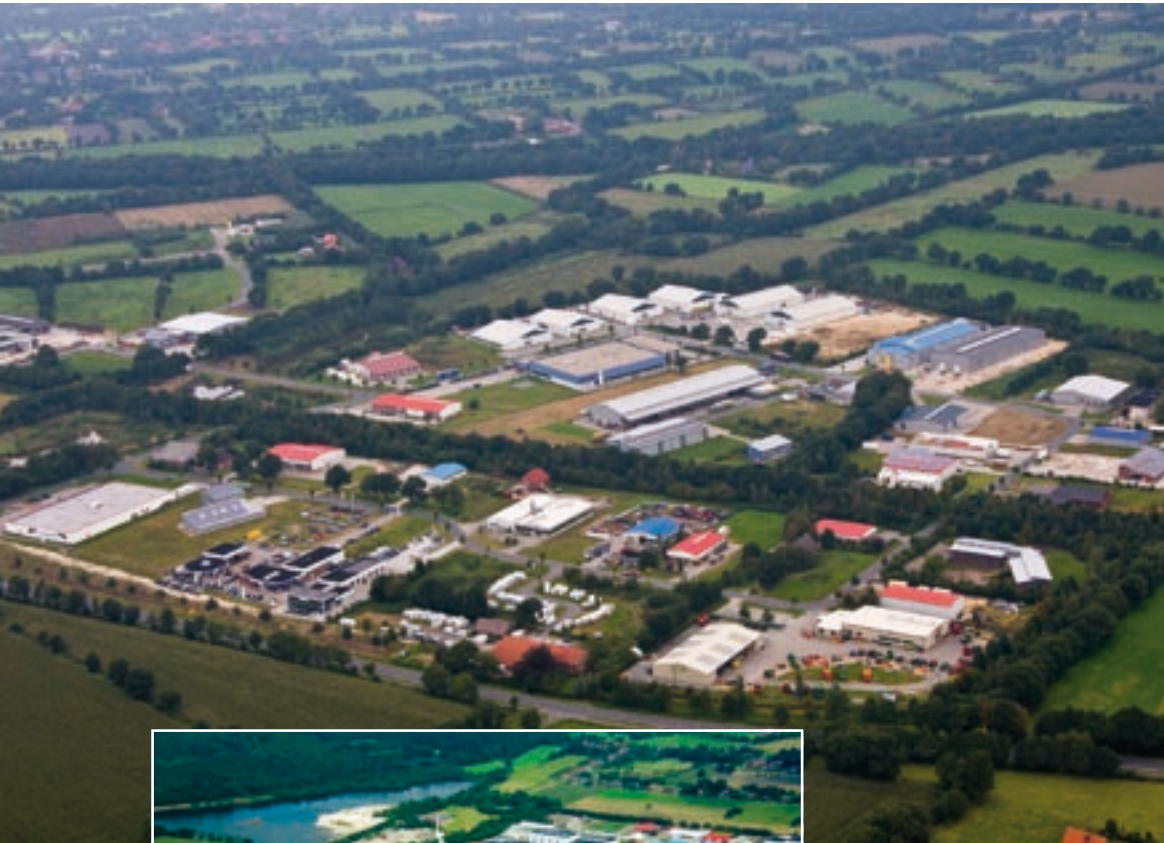
Industrie- und Gewerbegebiet Aurich-Süd in Schirum