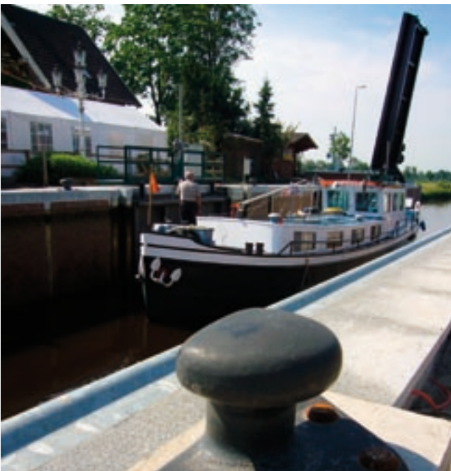
Schleuse Kukelorum, Stadt Aurich