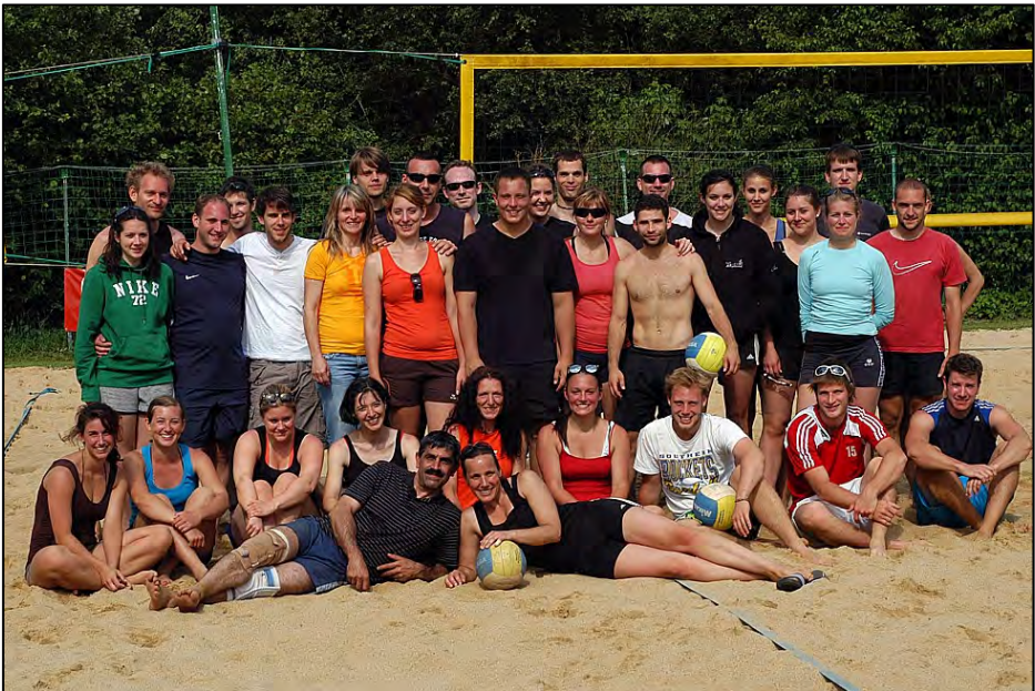
Freude pur nach dem Mixed-Turnier und Sonnenschein

Am Samstag 23. Juni wurden die BeachvolleyballerInnen beim Turnier auf der Beachvolleyballanlage-Anlage des Trimmelter SV von der Witterung richtig verwöhnt: sonnig bis leicht bewölkt (perfekt fürs Beachvolleyballturnier). Somit bestanden die besten Voraussetzungen, das 19. Beach-Masters wie gewohnt durchzuführen – auch war das Interesse an dem Turnier so groß, dass nicht alle anfragenden Mannschaften teilnehmen konnten.