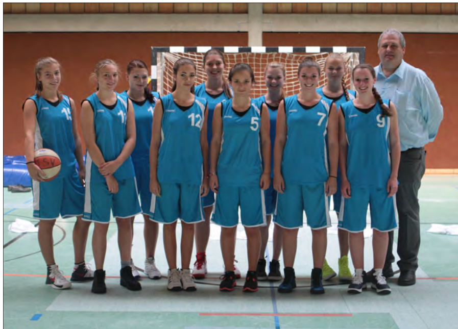
Die weibliche U19 in der Saison 2012/13.