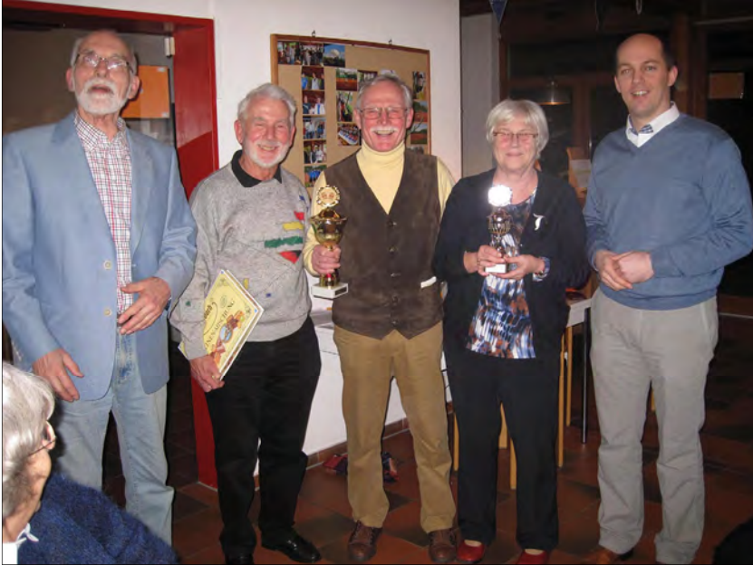
Siegerehrung der 10. TSV-Doppelkopf Meisterschaft