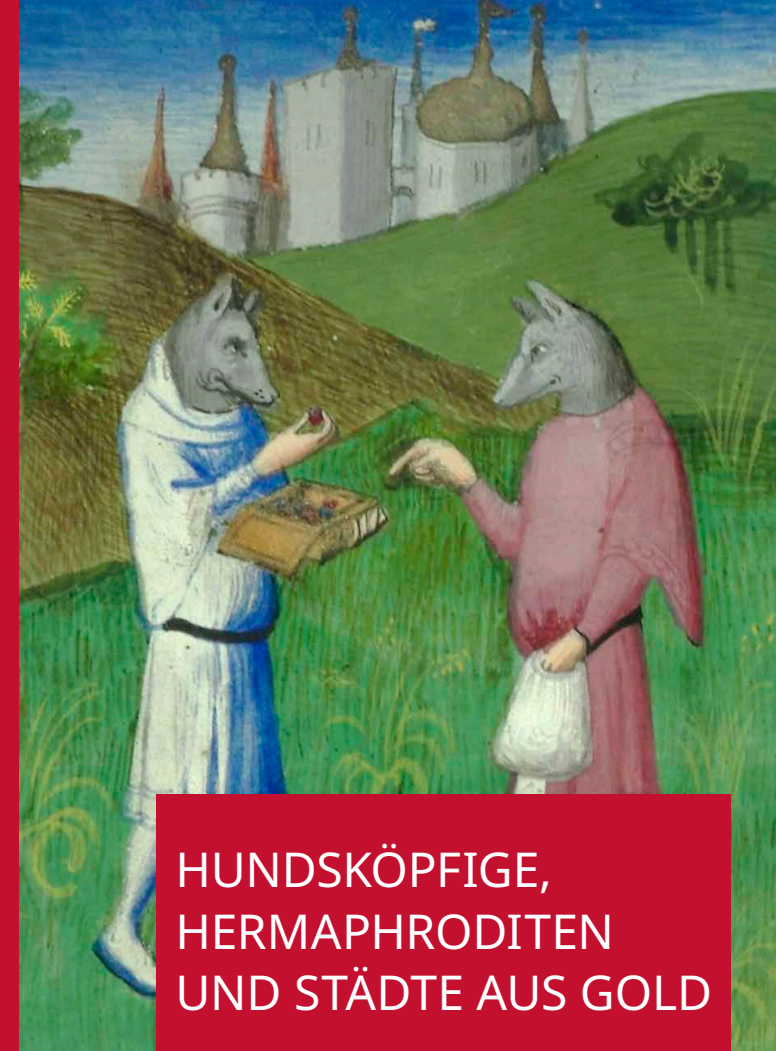
Abb.: BnF Fr2810, fol. 76v, https://creativecommons.org/licenses/by-sa/3.0