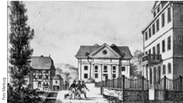
„Anatomische Theater“: Marburger Anatomiegebäude in der zweiten Hälfte des 19. Jahrhunderts. Lithographie von Friedrich Carl Vogel.

Die Universitäten, deren Dotationen zunächst sämtlich gestrichen worden waren, wurden von der zentralen, dem Innenministerium unterstellten „Generaldirektion für den