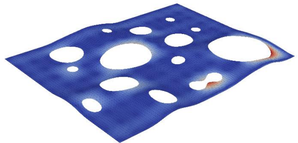
Rolex Learning Center der École polytechnique fédérale de Lausanne

Im Rahmen der Bachelorarbeit soll die Berechnung der Hauptspannungen und der Hauptspannungstrajektorien im lehrstuhleigenen FE-Forschungscode implementiert und validiert werden. Der Code basiert auf der Isogeometrischen Analyse (IGA), die eine Sonderform von FEM darstellt. Der Code ist in Matlab programmiert. Die Ergebnisse sollen mit der Datenbank EvaDAT validiert werden, die eine Reihe von Referenzlösungen zur Verfügung stellt. Die Implementierung soll für unterschiedliche Elementformulierungen durchgeführt werden (z.B. Scheiben-, Schalen- und Volumenelemente).