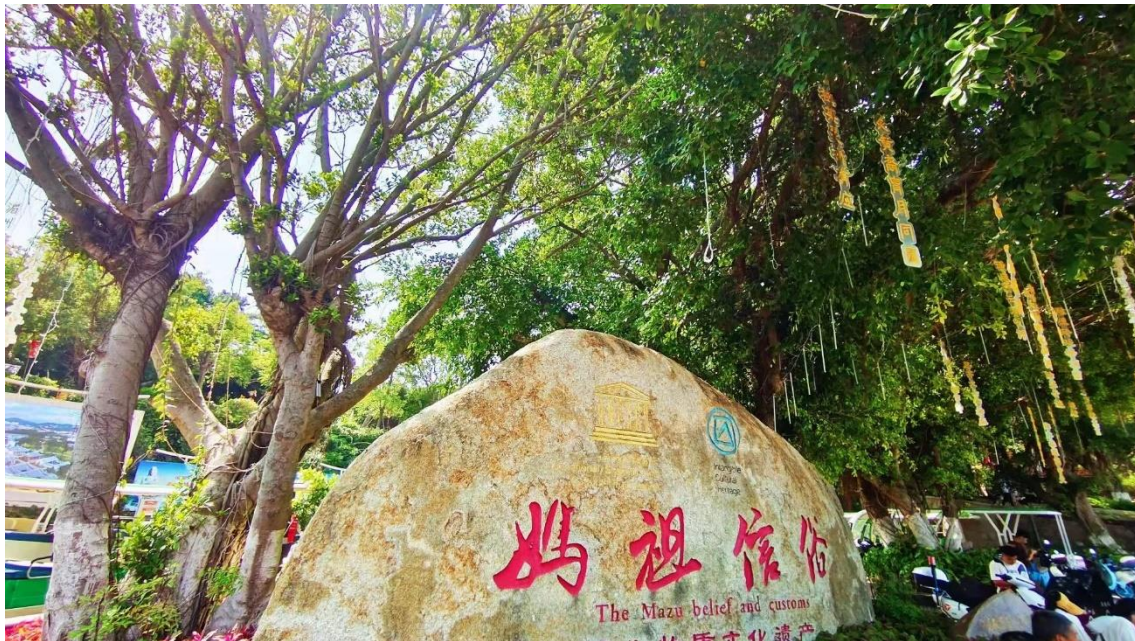
Fig. 2.2 The stone to show the ICH in Meizhou Island

( https://ich.unesco.org/en/RL/mazu-belief-and-customs-00227 )