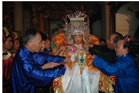
Fig. 2.1 UNESCO ICH page

( https://ich.unesco.org/en/RL/mazu-belief-and-customs-00227 )