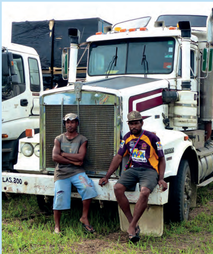
Unter dem Einfluss wirtschaftlicher Grossprojekte nimmt u.a. der Transport von Gütern durch das Siedlungsgebiet der Wampar enorm zu. Das Foto entstand 2009 in Papua-Neuguinea.

Projekttitle: Tax Incentives for Reducing Energy Consumption. An Empirical Evaluation of Tax Reforms in Swiss Cantons Fachbereich: Ökonomie, Kultur- und Sozialwissenschaftliche Fakultät Eingeworbene Summe (gerundet): 177'000 Franken