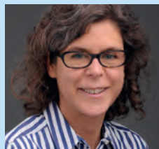
Projektleiterin Prof. Dr. Bettina Beer.

Internationales Kapital und lokale Ungleichheit Das Projekt untersucht anhand von zwei Dörfern der Bevölkerungs- und Sprachgruppe der Wampar in Papua-Neuguinea, wie durch den Einfluss von zwei kapitalintensiven Projekten zur Rohstoff- bzw. Energiegewinnung – einer Kupfer-Gold-Mine und einer Holzplantage – soziale Ungleichheit auf lokaler Ebene zustande kommt. Mittels eines Vergleichs der beiden Projekte soll festgestellt werden, durch welche sozialen Prozesse Personen und Gruppen unterschiedlichen Zugang zu neuen wirtschaftlichen Möglichkeiten erhalten und wie sie negative Begleiterscheinungen bewältigen. Ebenfalls ist es ein Ziel, zu erforschen, wie sich dadurch Geschlechter- und Generationenbeziehungen sowie Beziehungen zwischen Angehörigen verschiedener ethnischer Gruppen verändern. Die Ergebnisse sollen Grundlagen zur Entwicklung besserer Massnahmen zum Schutz lokaler Bevölkerungen und zur Teilhabe am Gewinn solcher Rohstoffprojekte beitragen. Das Team besteht neben Bettina Beer aus Postdocs sowie einer Doktorandin bzw. einem Doktoranden.