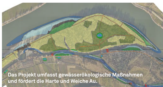
Das Projekt umfasst gewässerökologische Maßnahmen und fördert die Harte und Weiche Au.

Im Rahmen von LIFE Sterlet werden junge Sterlets gezüchtet, um sie dann in geeigneten Gewässerabschnitten in die Freiheit zu entlassen.