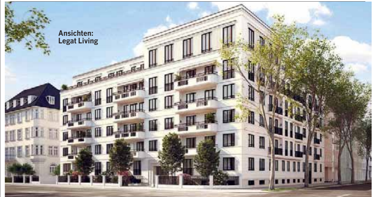
Ansichten: Legat Living