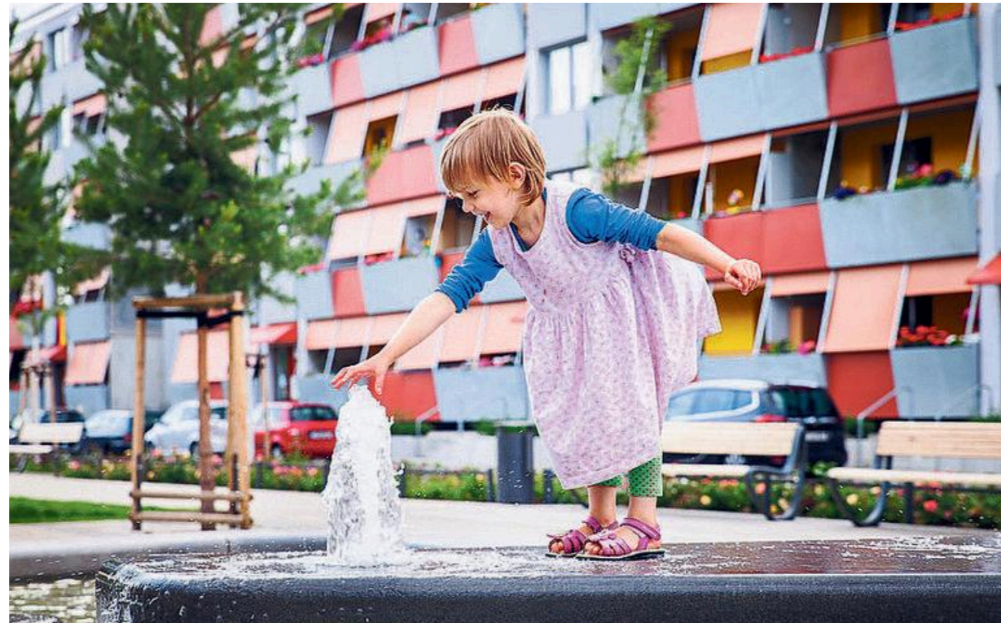
„Glücksmomente“: Ein Kind spielt auf einem Springbrunnen im Plattenbauviertel, heute „Gartenstadt“ Potsdam-Drewitz

Jahrelang galten die Großsiedlungen in ostdeutschen Städten als Problemviertel. Jetzt sind sie bei vielen Bürgern wieder beliebt – und gelten sogar als Vorbild für neue Serienbauten