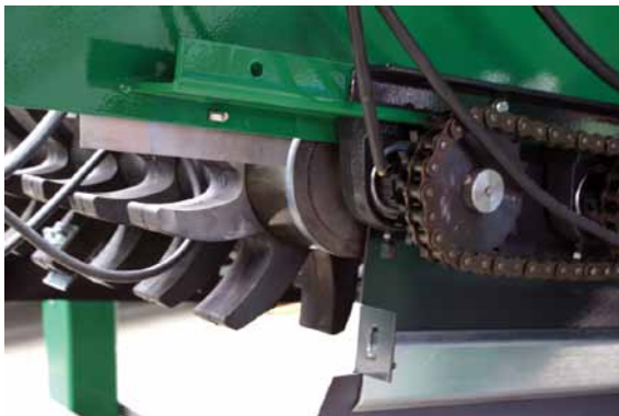
Abbildung 5: Siebsterne: Die Wellen, auf denen sie montiert sind, werden über Ketten angetrieben.