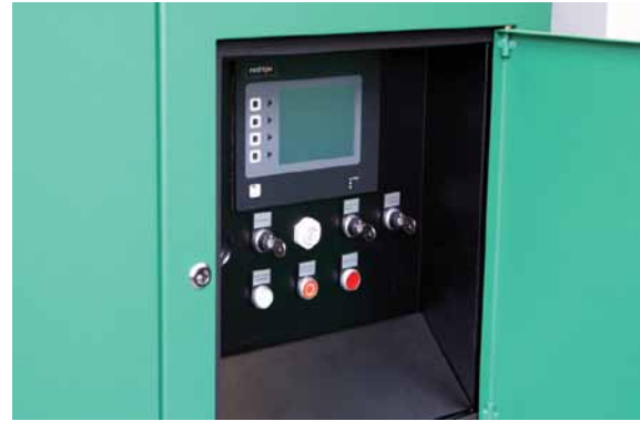
Abbildung 1: Das Touch-Panel von Wachendorff ermöglicht eine einfache Bedienung der komplexen Siebanlagen.

Für Ralf Kaiser steht als nächstes die Fernwartung aller Maschinen an – ebenfalls mit Wachendorff. Über das Teleservice-Gateway eWON sollen dann auch die mobilen Maschinen, die oft an abgelegenen Orten zum Einsatz kommen, von Ferne überwacht werden können. Die Verbindung wird hier dann per UMTS/MSDPA hergestellt.