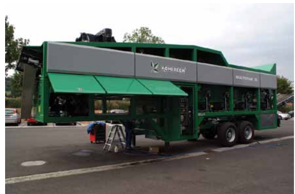
Abbildung 3: Letzte Handgriffe: Diese Maschine wird bald nach Frankreich geliefert und dort für die Zerkleinerung von Traubenrückständen aus der Weinherstellung eingesetzt. Sie ist als Auflieger konzipiert und kann mit einer Zugmaschine an den jeweiligen Einsatzort gebracht werden.