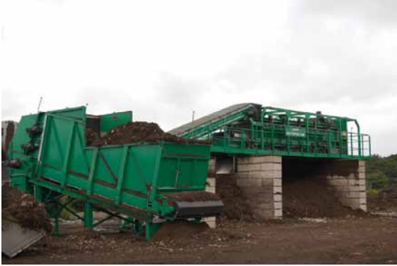
Abbildung 10: Stationäre Maschinen werden oft auf Mülldeponien oder bei der Herstellung von Blumenerde verwendet.

Weitere Informationen: Rufen Sie uns unter Tel. +49 (0) 67 22 / 99 65-966 an, senden Sie uns eine E-Mail an EEA@wachendorff.de oder besuchen Sie uns im Internet: www.wachendorff.de/g300