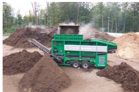
Abbildung 9: Mobile Maschinen sind meistens als Auflieger oder mit Deichsel konzipiert und können so zum Einsatzort befördert werden.