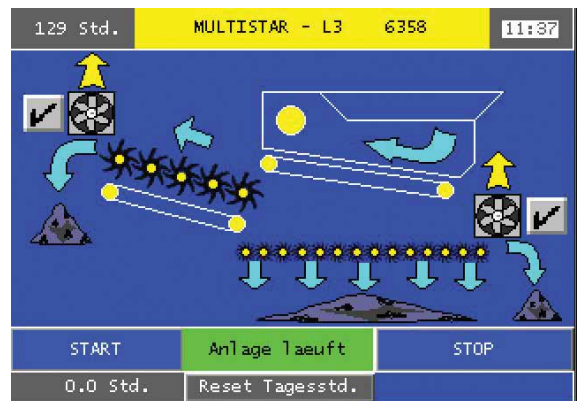
Abbildung 8: So sieht die Visualisierung aus, die Ralf Kaiser entwickelt hat. Mit ihr wird die Bedienung zum Kinderspiel.