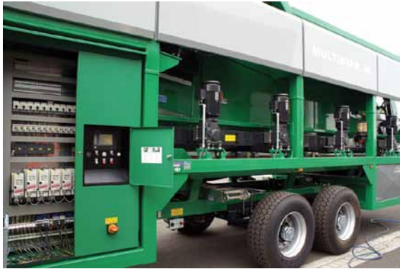
Abbildung 4: Das Bediengerät von Wachendorff befindet sich in der Schaltschranktür und greift direkt auf die Steuerung zu.