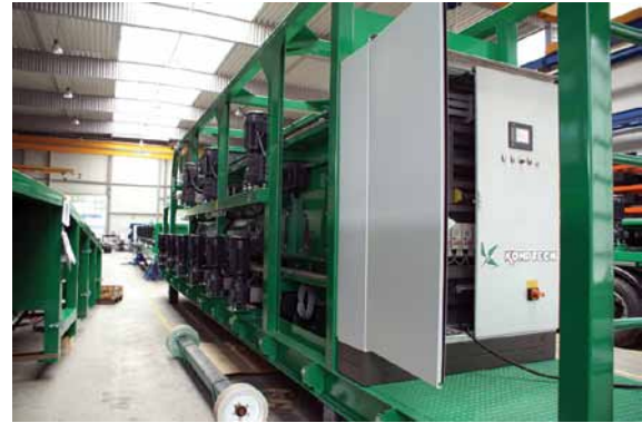
Abbildung 7: Hier eine stationäre Maschine mit mehreren Siebdecks in der Endmontage. Die Drehzahl der Motoren lässt sich über Frequenzumrichter variieren. Das Bediengerät von Wachendorff ist in die Schaltschranktür integriert.