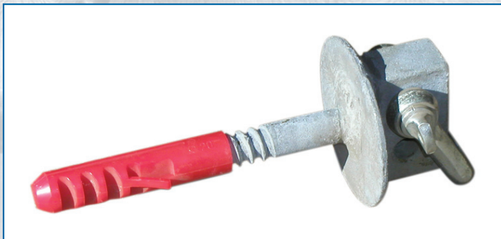
schraubbar, verzinkt für Rinderhalsrahmen o.dgl.