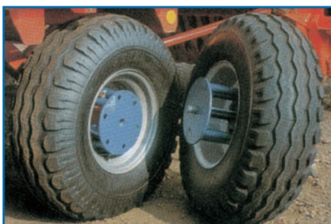
Anbauteile für Zwillingbereifung Gr. 10-15 bis 15-17, Felgen-Anschluss 161/205/6/0