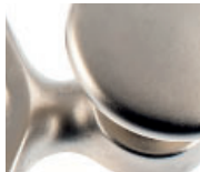
Messing vernickelt matt