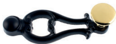
Ruder Guss schwarz lackiert Flachknopf Messing poliert