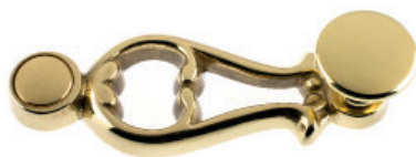
Ruder mit Flachknopf Messing poliert