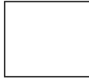
Guss NCS/RAL lackiert