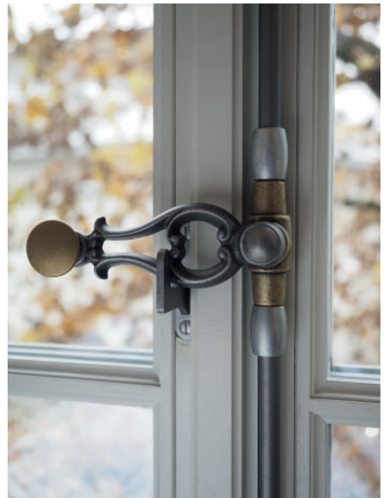
Ruder Guss mit Flachknopf Messing roh Garnitur roh mit Klarlack lackiert