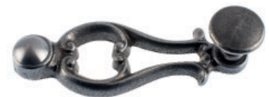
Ruder mit Flachknopf Guss roh