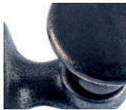
Guss altblank lackiert