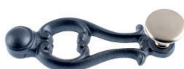
Ruder Guss altblank lackiert Flachknopf Messing vernickelt matt