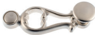
Ruder mit Flachknopf Messing vernickelt matt