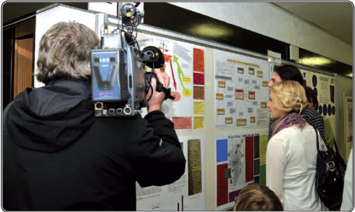
Schüler betrachten ihre Plakate während der Eröffnung der Ausstellungsreihe im Meldorfer Amtsgericht. Gefilmt werden sie vom NDR.