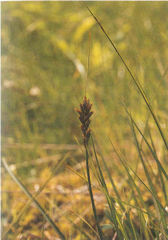
Abb. 1: Blysmus compressus im Caricetum davallianae

Blysmus compressus wurde in der „Roten Liste der gefährdeten Pflanzen in Unterfranken“ mit dem Gefährdungsgrad 1 eingestuft und zählt damit zu den akut vom Aussterben bedrohten Arten, für die Schutzmaßnahmen dringend notwendig sind, wenn man ihren Fortbestand in Unterfranken sichern will.