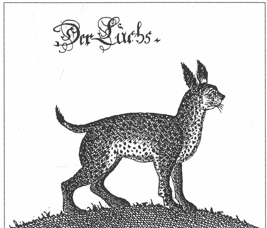
Abb. 3: „Der Luchs“ (Zeichnung aus FLEMMING, 1749)

Nur noch in den Steillagen des Maintals konnte sich eine Restpopulation halten, bis 1693 die Erlegung des letzten Luchses im Amt Lohr den Abschluß des