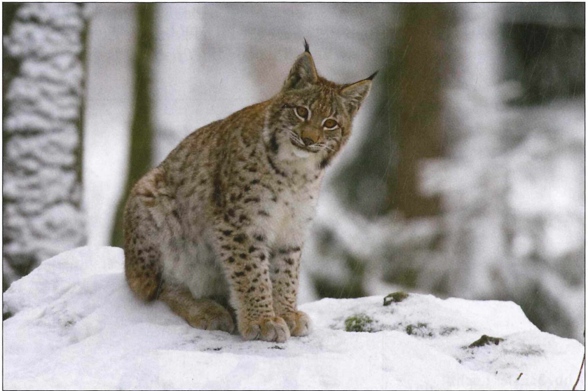
Abb. 4: Eurasischer Luchs ( Lynx lynx )

Dieses Waidmannsheil wurde triumphal gefeiert – da wird es im Spessart nicht viel anders zugegangen sein, als im benachbarten Thüringer Walde. In munterem Jagdzug marschierte die Jägerei nach Rothenbuch, voraus der Oberjäger