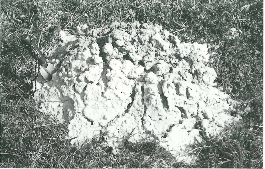
Abb. 3: Mit diesem Hügel hat ein Maulwurf fast reinen Alm an das Tageslicht geschoben (Wiese im Paartal südlich von Mering).

Eine andere Art der Kalkausfällung und -anreicherung ist der so genannte Wiesenalk oder Alm, wie er in Bayern genannt wird (dieser Ausdruck stammt von der römischen Bezeichnung „terra alba“ = weiße Erde). Besonders mächtige Vorkommen gibt es in den großen glazifluvialen Entwässerungsrinnen der eiszeitlichen Gletscher. Dazu zählt das etwa von Geltendorf bis Mering verlaufende Tal der Paar. Dorthin führt uns der andere der beiden Zufälle, von denen in diesem Bericht die Rede ist. Bei den Erkundungen zu unserem Bericht über „Die Altmoränen-Landschaft nördlich des Ammersees“