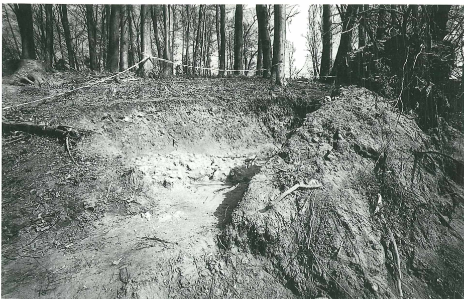
Abb. 1: Das vom Arbeitskreis für Vor- und Frühgeschichte des Heimatvereins für den Landkreis Augsburg sorgfältig freigelegte Wurzelbett einer vom Sturm „Lothar“ gefälltten Buche. Unter dem etwa 1 m mächtigen Waldboden zeigten sich rundliche Kalkkörper, die man für Totenschädel halten könnte.

Angestoßen wurde die Grabung vom Grundherrn von Stetten. Der erste Augenschein ließ an eine Ansammlung menschlicher Schädel in irgendeiner Art von Friedhof denken und weckte wohl eine gewisse Hoffnung auf reiche archäologische Funde. Leider