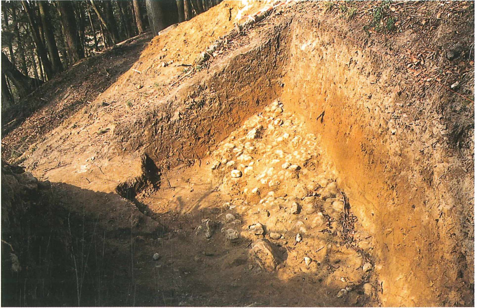
Abb. 2: Die kalkig gebundenen Sandkindeln liegen unter einer Bedeckung aus Sand der Oberen Süßwassermolasse (Tertiär). Der Abstand zur Oberfläche scheint für die ganze Lage gleich zu sein.

stellte sich heraus, dass die ominösen Gebilde lediglich dicht gepackte Kalkkonkretionen – besser gesagt: kalkig gebundene Sandkindeln – waren. Wie konnte es zu dieser Anreicherung kalkiger Ablagerungen kommen? Der Hammelberg trägt eine heute nur noch geringmächtige Kappe aus Deckenschottern des