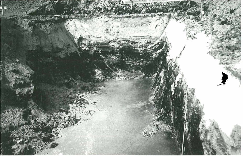
Abb. 4: In einer Baugrube in Egling a.d. Paar kam Alm in einer 1,5 m mächtigen Schicht (über Torf) zum Vorschein. Der Alm, feinkörnig und unverfestigt, kann leicht zwischen den Fingern zerrieben werden.