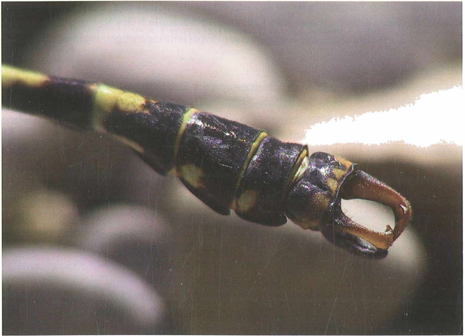
Abb. 3: Auffällige Greifwerkzeuge der männlichen Imago

Zwischen 16.8. und 2.9.2004 meist einzelne männl. Imagines von O. forcipatus an acht verschiedenen Fundorten