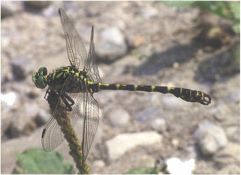
Abb. 2: Kleine Zangenlibelle ( Onychogomphus forcipatus ), männliche Imago

Einträge von O. forcipatus in der Artenschutzkartei Bayern 13 im Regierungsbezirk Schwaben: