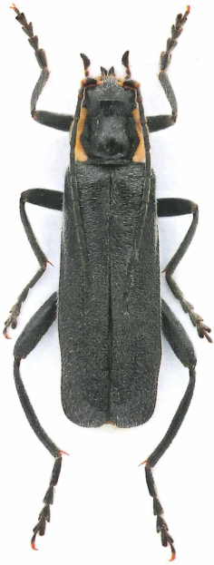
Cantharis paradoxa HICKER, 1960

material konnte anhand von Belegen vom 27.4.2014 (leg. Flechtmann) und Genitalpräparat bestätigt werden (Gü). Ein weiterer Fotobeleg folgte aus dem Tierpark Eekholt/SE 3.5.2014 (Flechtmann).