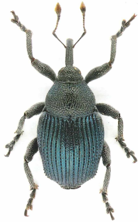
Ceutorhynchus canaliculatus BRISOUT DE BARNEVILLE, 1869