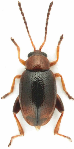
Longitarsus fulgens (FOUDRAS, 1860)

erichsoni (SUFFRIAN, 1841) sollen alle vorhandenen (historischen) Sammlungsexemplare einer genauen Prüfung unterzogen werden.