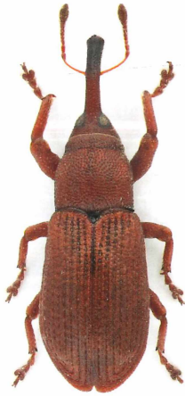
Magdalis rufa GERMAR, 1824