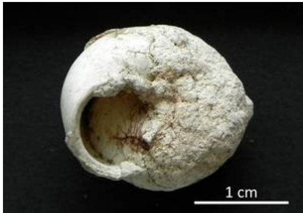
11. Arianta arbustorum (LINNAEUS 1758) Stark versintert; Preintalbrücke