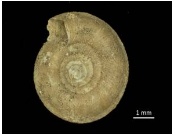
4. Discus perspectivus (MEGERLE v. MÜHLFELD 1816) Preintalbrücke