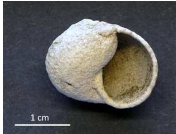
12. Helix pomatia LINNAEUS 1758 Stark versintert; Haslau