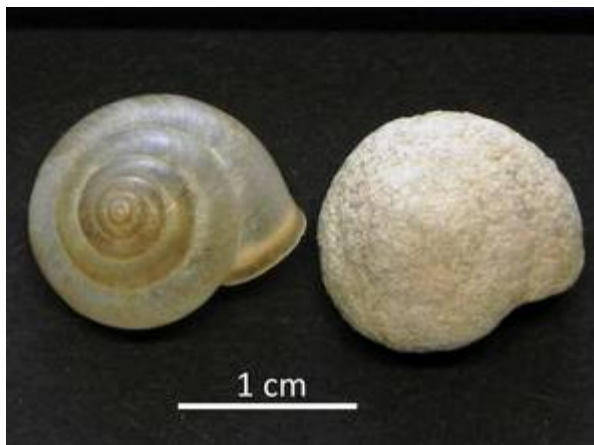
8 a, b. Monachoides incarnatus (O.F. MÜLLER 1774) a Frische (links) bzw. stark sinterverkrustete (rechts) Schale; Haslau b. Stark Verkrustete (links) bzw. frische (rechts) Schale; Haslau