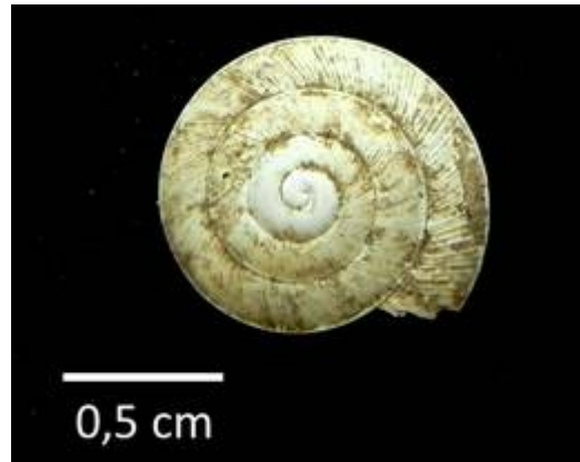
5. Aegopis verticillus (LAMARCK 1822) Teufelshöhle