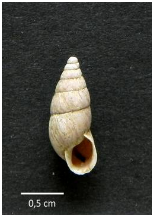
3. Ena montana (DRAPARNAUD 1801) Teufelshöhle