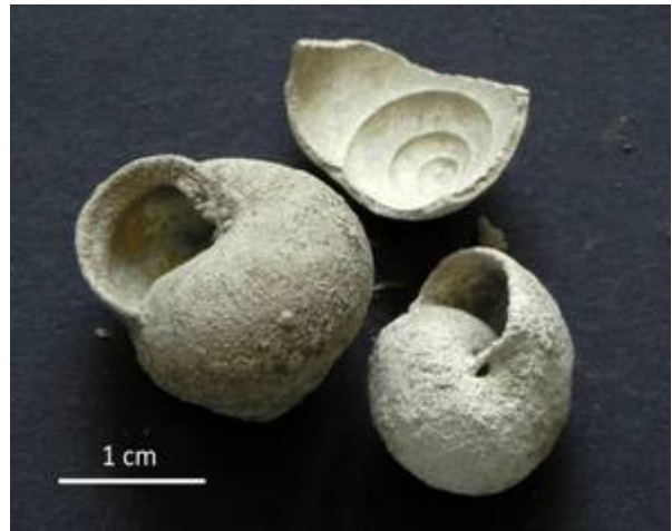
10. Arianta arbustorum (LINNAEUS 1758) Zwei stark versinterte Schalen bzw. eine Sinterkruste mit Schalenabdruck; Jakobsbrunnen