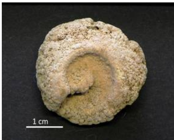
6. Aegopis verticillus (LAMARCK 1822) Tuffkern ; Haslau