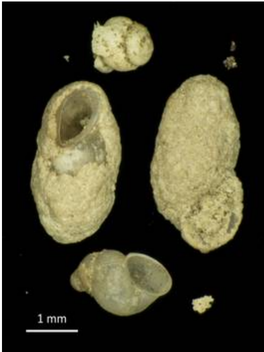
1. Bythinella austriaca (FRAUENFELD 1857) Jakobsbrunnen