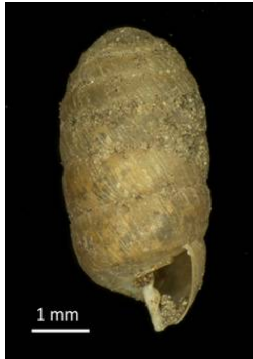
2. Sphyradium doliolum (BRUGUIÈRE 1792) Preintalbrücke