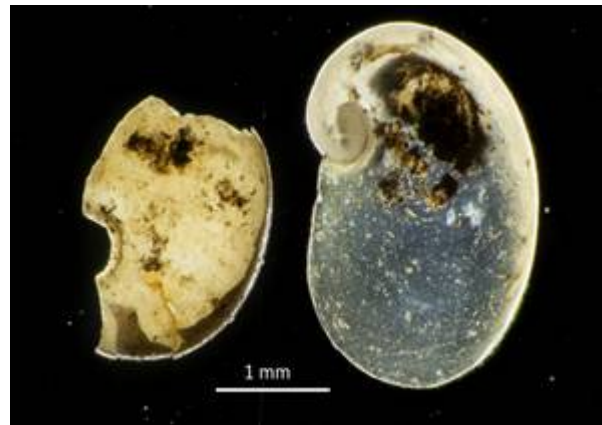
7. Semilimax semilimax (J. FÉRUSSAC 1802) Jakobsbrunnen