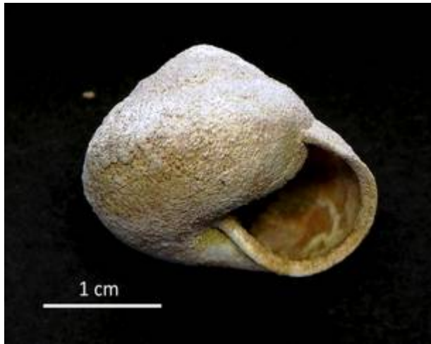
9. Arianta arbustorum (LINNAEUS 1758) Stark versintert; Haslau