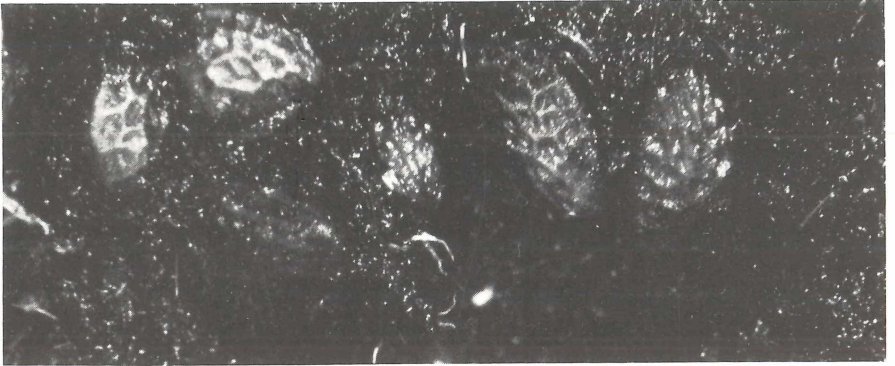
Abb. 2: Die Steinfruchtkerne von Rubus fruticosus s. l. im völlig durchwachsenen Gewölle unter dem Moospolster.

che Bindung dieses Moores an tierische Exkremente, Tierleichen bzw. deren Reste und besonders Gewölle. Diese Eigenschaft und ein weiteres Merkmal, die auffällige Vergrößerung der Apophyse, einer basalen Bildung der Sporenkapsel, haben schon früh die Aufmerksamkeit der Bryologen auf sich gezogen.