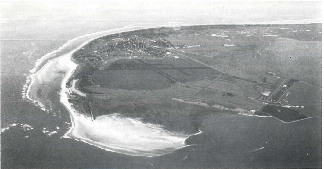
Abb. 1: Westteil der Insel Langeoog von SW: Flinthörn-Sandplate (vorn) mit dahinterliegendem Salzwiesenbereich, in der Bildmitte das rundliche Rollfeld (ehemaliger Flugplatz); deutlich erkennbar im unteren Teil der große, von Reit- und Fußwegen durchquerte Kriechweidenkomplex, in dem das Carex punctata -Vorkommen liegt, und dahinter das Wäldchen am S-Rand des Ortes.

Neben den in den Aufnahmen verzeichneten Arten wurden in diesem Bereich an Holzgewächsen noch Populus tremula , Salix pentandra , Rosa rubiginosa und Lonicera periclymenum festgetellt. Im Gebüsch wachsen u. a. Cirsium vulgare , Epilobium angustifolium , E. hirsutum , E. montanum , Eupatorium cannabinum und Mentha xverticillata (letztere nicht blühend, ohne Eltern!). An sonnigen Stellen fanden sich namentlich Arten mäßig feuchter bis nasser Wiesen: Anthoxanthum odoratum , Cerastium fontanum subsp. triviale , Galium mollugo , Lathyrus pratensis , Leucanthemum vulgare , Lychnis flos-cuculi , Medicago lupulina , Plantago lanceolata , P. major , Potentilla anserina , Prunella vulgaris , Ranunculus acris , R. flammula , Rhinanthus sp., Taraxacum sp., Trifolium pratense und Tussilago farfara . Auf nassen Wegen wuchs Eleocharis quinqueflora . An Pilzen wurden zwischen den Kriechweiden gefunden: Inocybe agarthii , I. dulcamara , I. lacera var. helobia , Mycena acicula und Omphalina velutipes (alle bestimmt von Th. W. Kuyper, siehe auch KUYPER 1986; z. T. nicht erwähnt von ARNOLDS 1983).