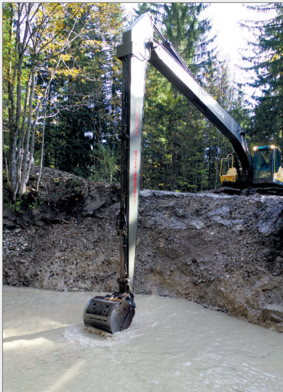
Abb. 13: Mit dem Spezialbagger wurde der Quelltopf bis in 10 m Tiefe freigelegt. Fig. 13: The source pot was re-exposed to a depth of 10 m using a special excavator.

te der Quelltopf erstmals wieder auf die geplante Spiegelhöhe gefüllt werden. Am Abend des 8.12.2016 floss zum ersten Mal Wasser über den fertigen neuen Überlauf des Quelltopfes. Das Ansaugrohr sowie die Wasserleitung blieben für etwaige Nutzung des Wassers erhalten. Weiters blieben der Grundablassschacht und das Grundabflussrohr bestehen, um den Wasserspiegel des Quelltopfes für Wartungsarbeiten oder wissenschaftliche Untersuchungen bei Niedrigwasser um fast 5 m absenken zu können. Insgesamt war es notwendig, im Zuge der Renaturierung an die 1500 m 3 Material aus dem Quelltopf zu entfernen und abzutransportieren.