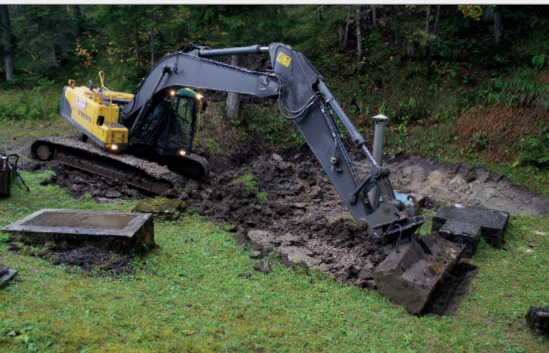
Abb. 11: Beginn der Renaturierungsarbeiten am 4.10.2016. Freilegung der Stahlbetondecke. Fig. 11: The beginning of the renaturation on October 4, 2016 and exposure of the concrete ceiling.