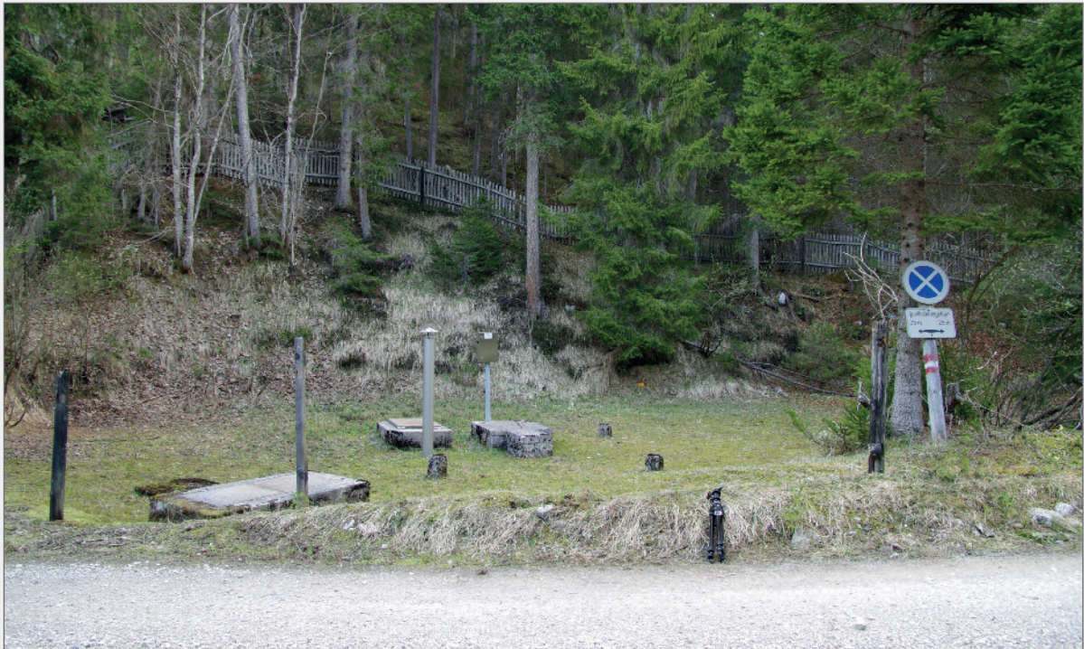
Abb. 9: Situation der Quellfassungsanlage vor Projektbeginn.