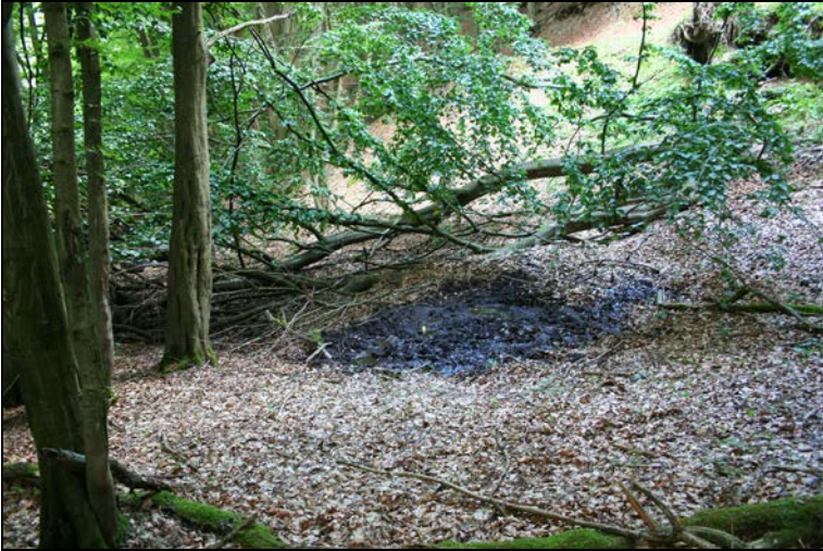
Abbildung 3: Am Rand der Bärenbachtalquelle 26 wurde die seltene Art Megaselia sheppardi gefunden.