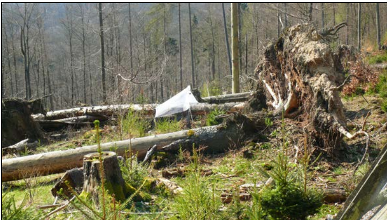
Abbildung 5: Malaisefalle auf der Husefläche (Windwurffläche).