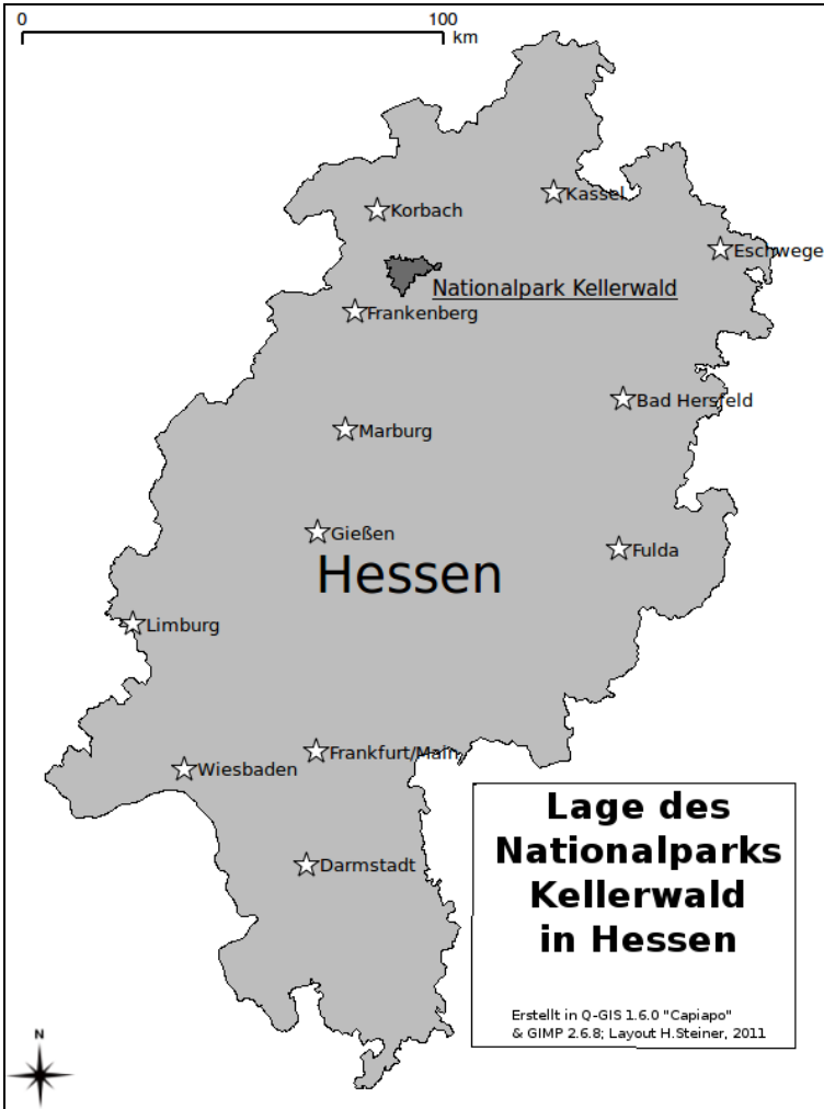
Abbildung 2: Karte des Bundeslandes Hessen mit dem Nationalpark Kellerwald.

Quellbach im Bärenbachtal (Abb. 3): ein Bachlauf mit schluchtartigen und schroffen Bergflanken; an den Hängen befinden sich Urwald-Relikte.