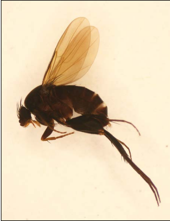
Abbildung 1: Buckelfliege Hypocera mordellaria , Männchen, Huseflähe.