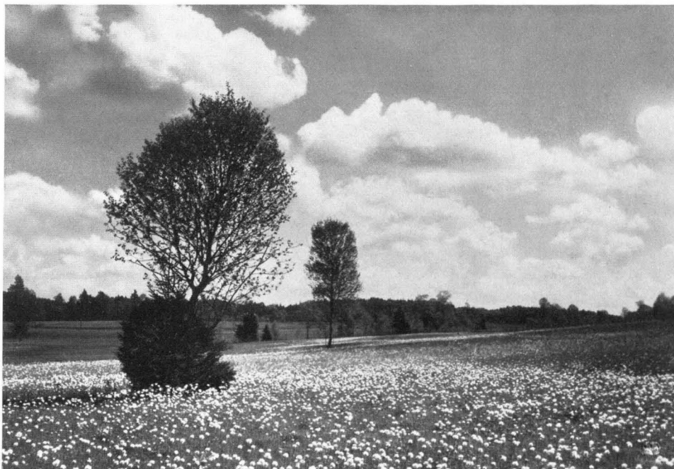
Bild 7 Massenbestände von Trollblumen auf einer Streuwiese im Naturschutzgebiet Kirchseemoor bei Bad Tölz. Ähnlich reiche Bestände bei Rott (Lkr. Landsberg) sind z. Z. durch ein Flurbereinigungsunternehmen schwer bedroht.