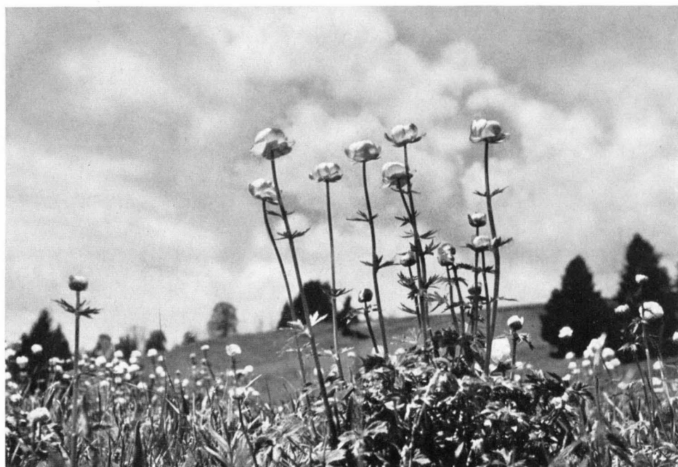
Bild 8 Von der Schönheit der Flora der Streuwiesen: Die Trollblume (Trollius europaeus). Da bei weitem nicht alle wertvollen Streuwiesen unter Naturschutz stehen, müssen neue Wege zu ihrer Erhaltung gesucht werden.