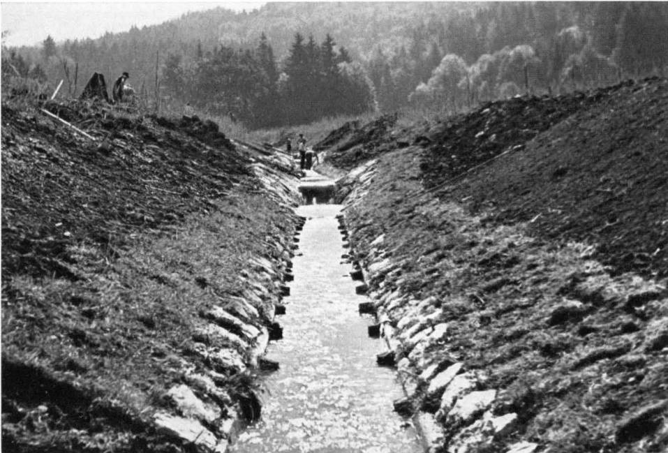
Bild 10 Mit der Entwässerung und Kultivierung von großen Teilen des Bergener Moores im Chiemgau, das ein wichtiges Wasserrückhaltebecken im Einzugsgebiet des Chiemsees war, gingen große Bestände geschützter Pflanzen verloren (Aufnahme aus dem Jahr 1952).