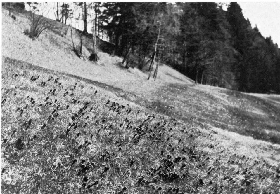
Bild 3 Stengelloser Enzian auf einem flächigen Grundwasseraustritt (Hangquellmoor) am Nordrand des Gaißbacher Rieds bei Bad Tölz.