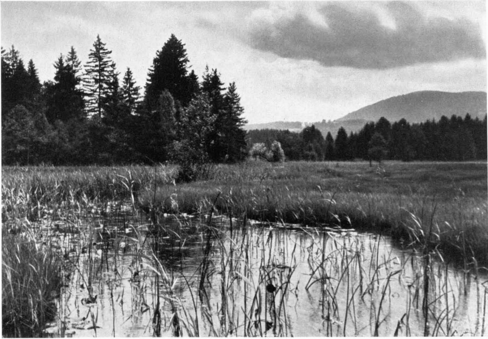
Bild 5 Strewiesen längs des Rothbaches bei Rothenrain unweit Bad Tölz. Niedermoorkomplexe sind nicht nur floristisch ungemein interessant; sie spielen meist auch eine wichtige Rolle im natürlichen Wasserhaushalt.