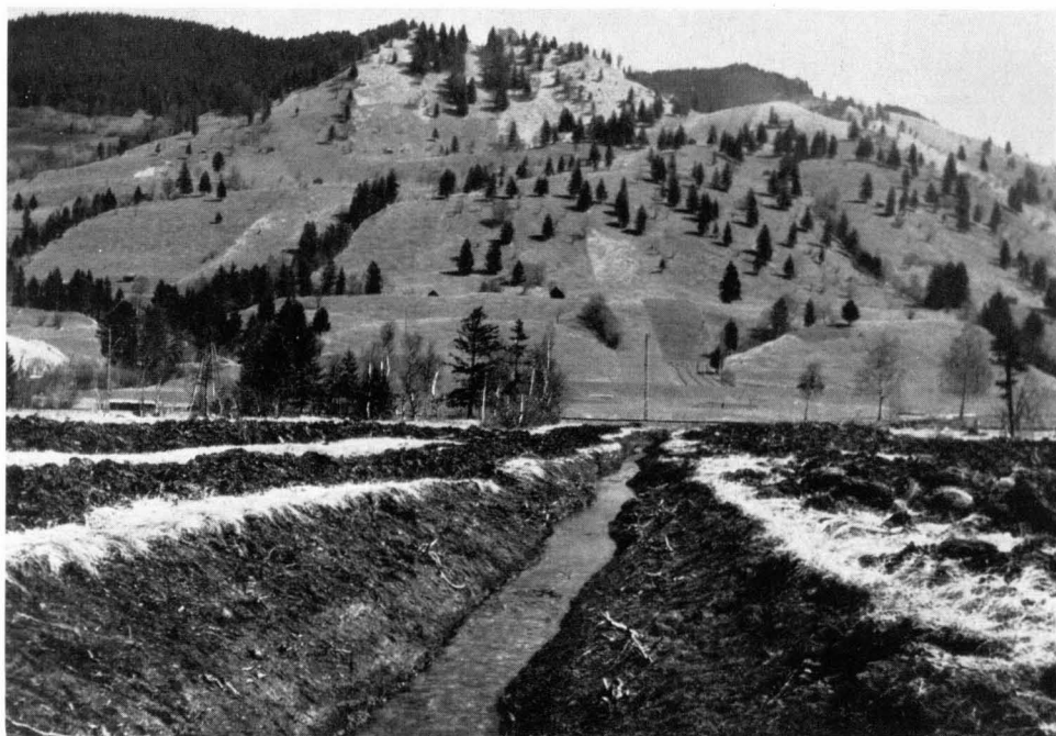
Bild 12 Entwässerungen bei Unterammergau in Oberbayern. Hier wurden nicht nur „ankultivierte“ Streuwiesen, sondern auch unberührte Flachmoorbestände betroffen (1962).