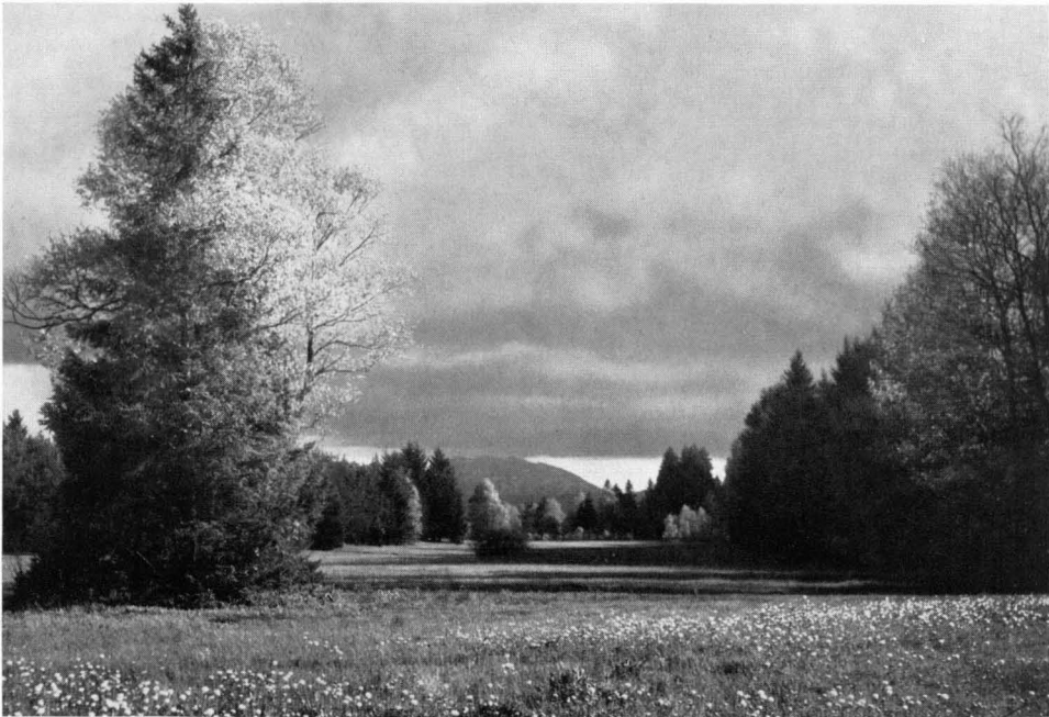
Bild 6 Ausschnitt aus dem Naturschutzgebiet Ellbacher Moos bei Bad Tölz. Im Vordergrund Trollblumen auf einer ausgedehnten Strewiese. Selbst in Naturschutzgebieten wurden zu wiederholten Malen Entwässerungen oder Kultivierungen durchgeführt!