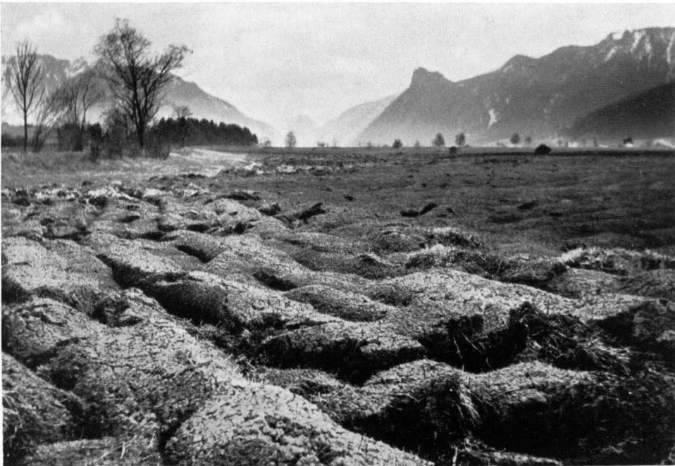
Bild 14 Weitläufige Umbrüche auf ehemaligen Streuwiesen bei Unterammergau in Oberbayern (1962). Hier wurden allerdings zum Teil bereits veränderte Streuwiesen betroffen.