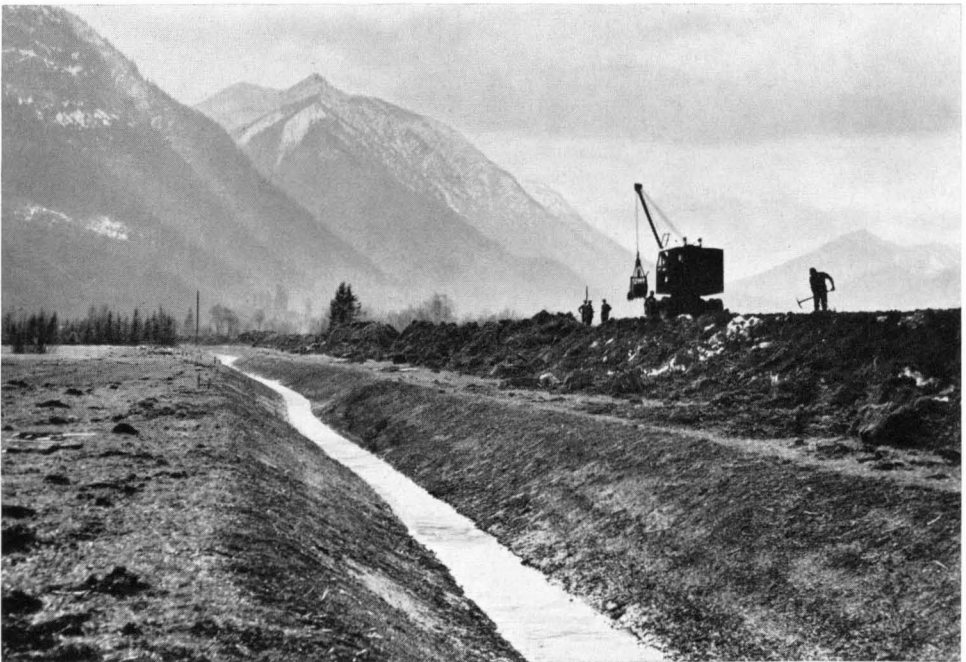
Bild 16 Instandsetzungsarbeiten an der regulierten oberen Ammer im berühmten Weidmoos bei Ettal in Oberbayern (1963). Durch Verhandlungen konnte die beabsichtigte Entwässerung von Teilen dieses wasserwirtschaftlich wie floristisch berühmten Moooses verhindert werden. Hier befindet sich der größte Standort des Eiszeitrelikts König Karls-Zepter in Mitteleuropa.