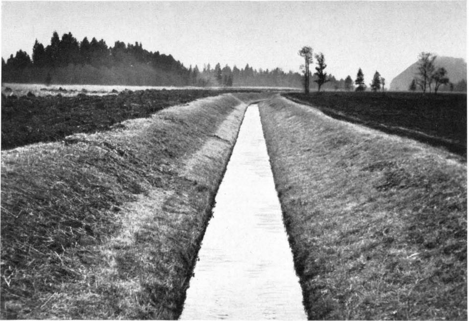
Bild 15 Großflächige Umbrüche wertvoller und wasserwirtschaftlich wichtiger Streuwiesen längs der regulierten Aitrach bei Sossau unweit des Chiemsees (1962). Bei der vereinbarten unbruchslosen Verbesserung wäre vielleicht die Erhaltung eines Teiles der Flora zu erwarten gewesen.