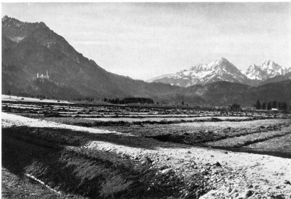
Bild 11 Im Vorfeld des Schlosses Hohenschwangau bei Füssen — in einer solchen Landschaft! — wurden noch in den fünfziger Jahren als Ausgleich für den durch den Roßhauptener Speicher verursachten Landverlust riesige Flächen von wertvollen Streuwiesen entwässert und damit deren Flora zerstört.