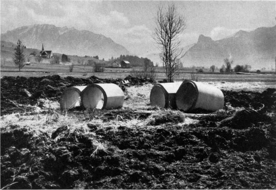
Bild 13 Ausschnitt aus den Entwässerungsarbeiten bei Unterammergau. An dieser Stelle gingen neben verschiedenen Enzian- und Orchideenarten auch zahlreiche Exemplare des König Karls-Zepters ( Pedicularis sceptrum carolinum ) verloren.