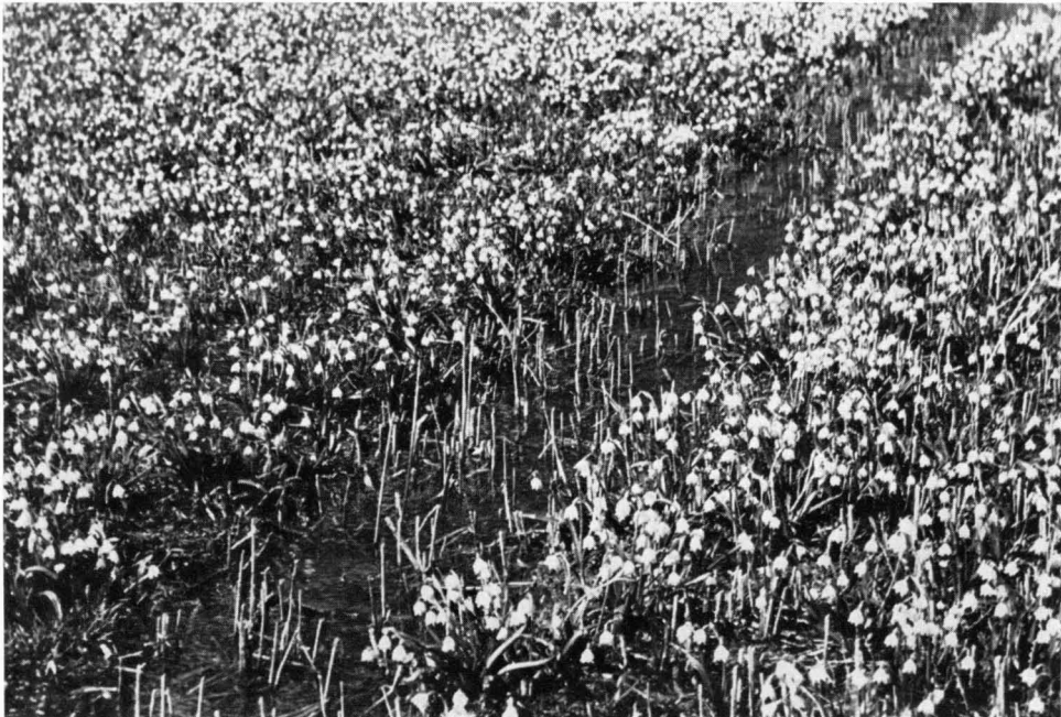
Bild 2 So viele Schneeglöckchen (Leucoium vernum) kann es auf einer Strewwiese geben!