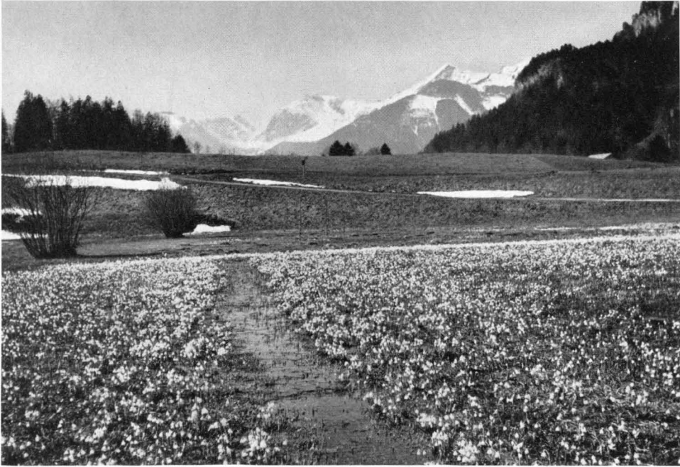
Bild 1 Strewwiese bei Raithen unweit Schleching im Tal der Tiroler Achen. Mit der Entwässerung, die 1950 geplant war, wären die Massenbestände an Großem Schneeglöckchen verlorengegangen.