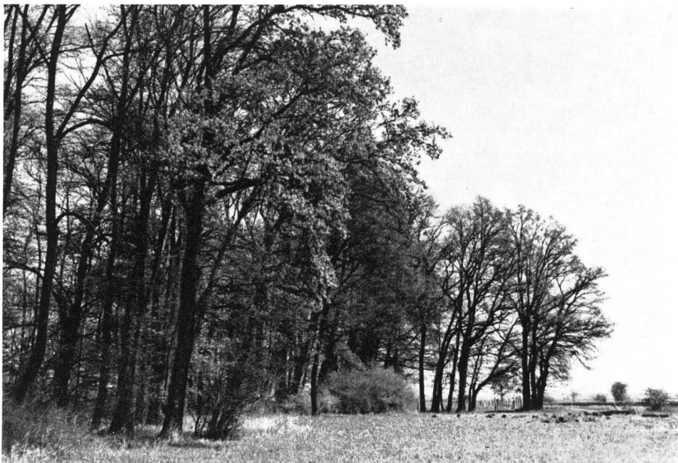
Abb. 8 Rest des ehemaligen Lohwaldgürtels, der einst die Grenzbereiche des Moores zu den jüngeren Schotterflächen besiedelte