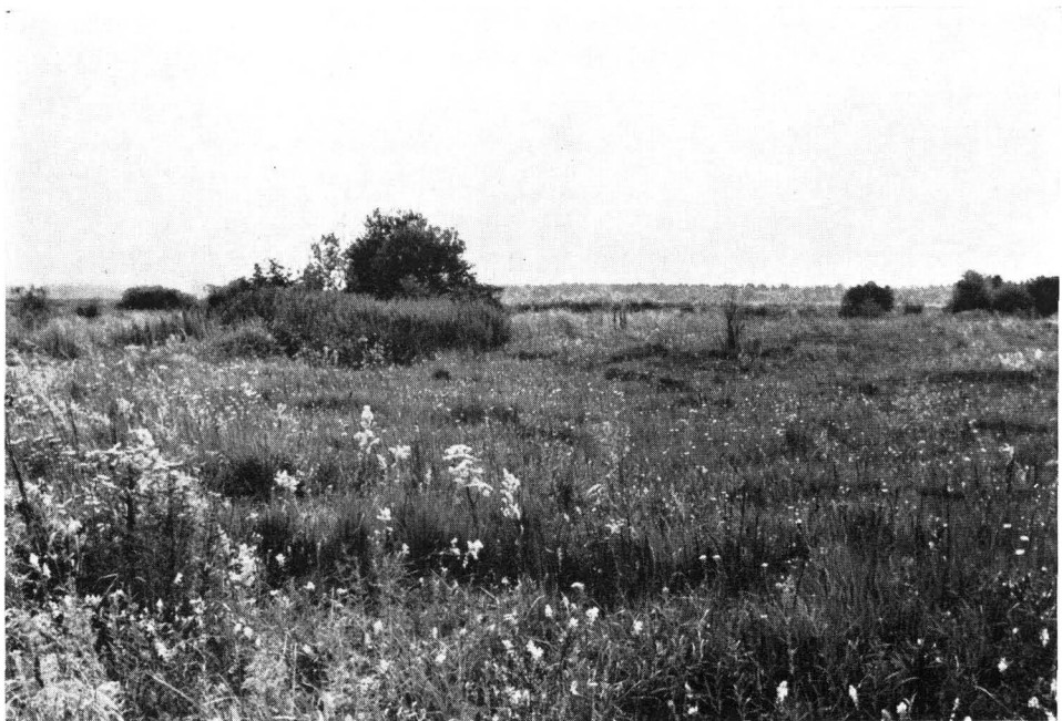
Abb. 4 Ausgedehnte Streuwiesenbereiche sind kennzeichnend im nördlichen Moosbereich