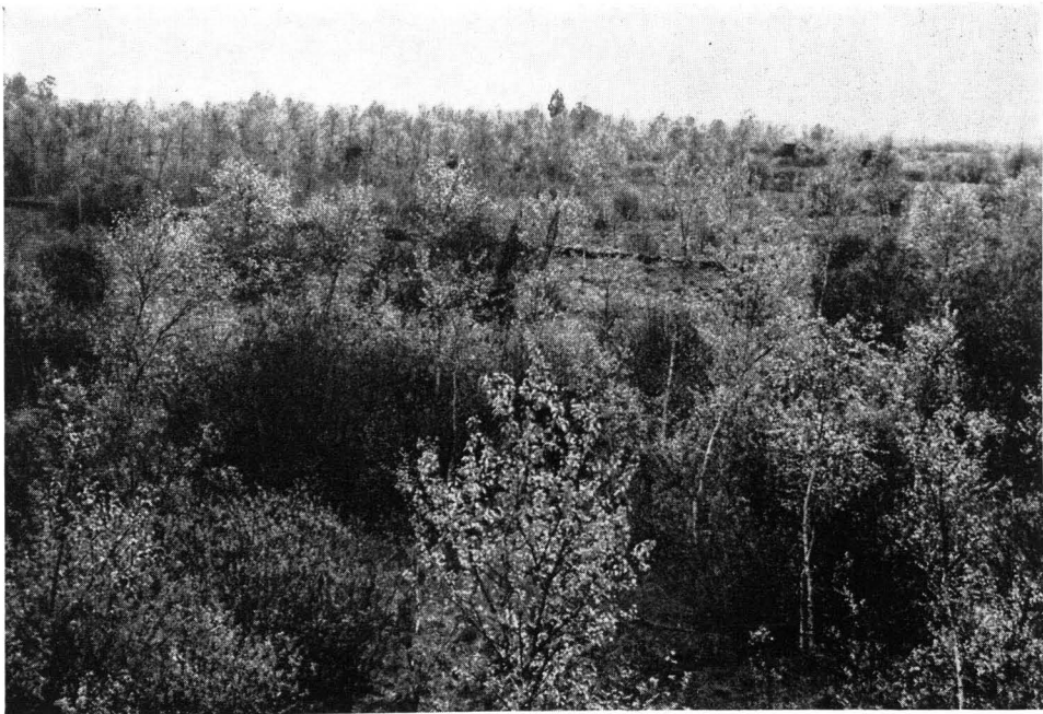
Abb. 2 Sekundär aufgekommener Baum- und Strauchbewuchs bestimmt meist den Aspekt der ehemaligen Moorkerngebiete