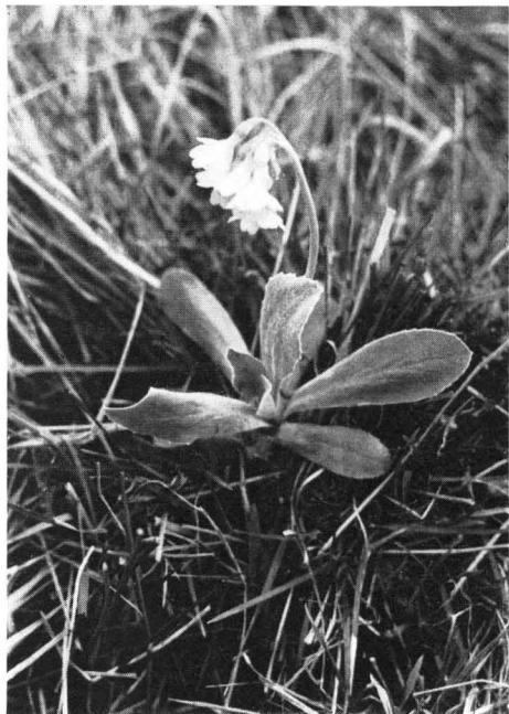
Abb. 5 Nur noch wenige Exemplare der Alpenvorlandaurikel ( Primula auricula var. monacensis ), die einst zu Tausenden das Erdinger Moos besiedelten, konnten sich noch bis in unsere Tage erhalten.