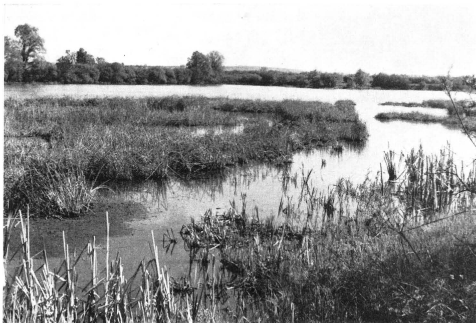
Abb. 7 Der seit längerer Zeit aufgelassene Eittinger Stausee ist ein beachtenswertes Vogelreservat