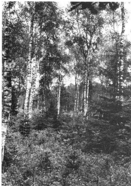
Abb. 6 Vorbildlich gepflegter Baumbestand mit mehrstufigem Unterwuchs im Bereich der ehemaligen Abtorfungsfläche bei Zengermoos westlich Eichenried bei Erding.