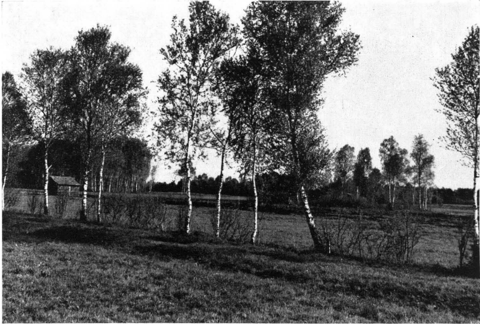
Abb. 1 Landschaftsbild aus dem mittleren Erdinger Moos