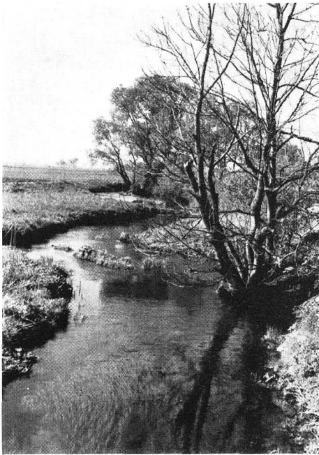
Abb. 3 Unregulierter, unter Landschafts- schutz stehender Bachlauf im östlichen Erdinger Moos