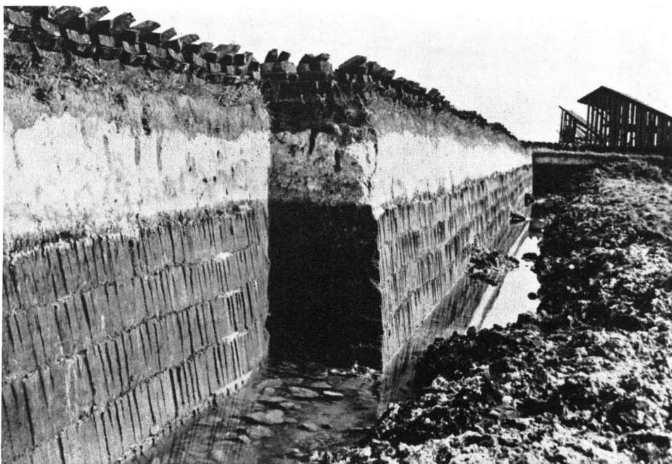
Abb. 9 Bodenprofil aus dem mittleren Erdinger Moos. Über dem Torf liegt eine ca. 50 cm mächtige Almschicht