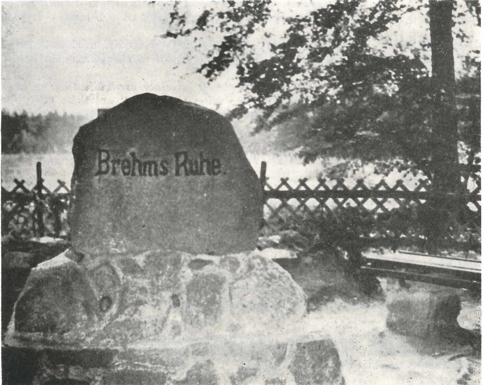
Abb. 2. Gedenkstein „Brehms Ruhe“, heutige Ansicht