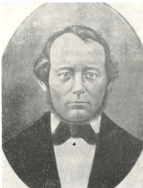
Abb. 5. CARL CHRISTIAN FISCHER (1818—1872)