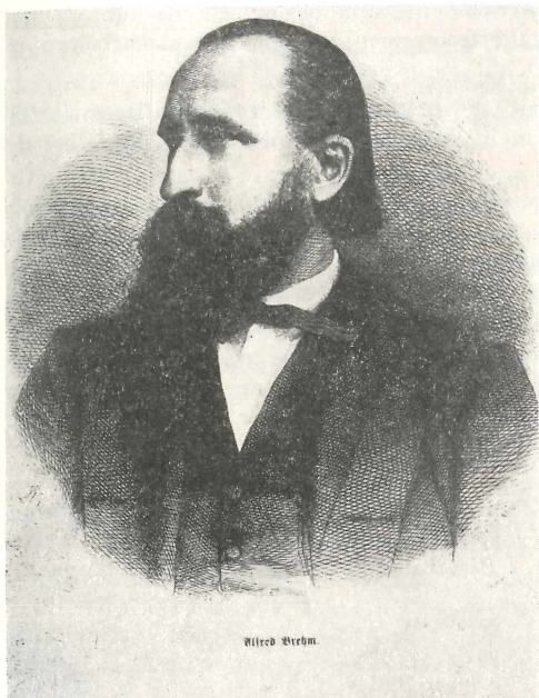
Abb. 4. Dr. A. E. BREHM (etwa 1869)