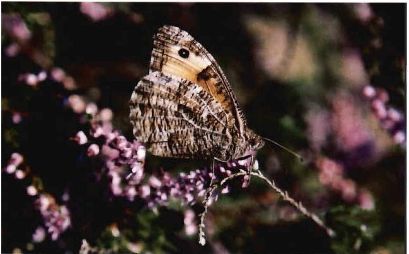
Abb. 2: Hipparchia semele (LINNÆUS, 1758) im ehemaligen Munitionsdepot Brüggel-Bracht, 18.8.2992