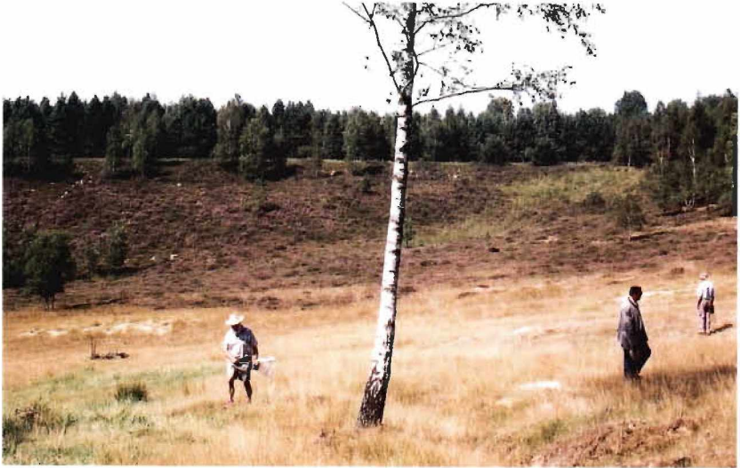
Abb. 1: Heideflächen im ehemaligen Munitionsdepot Brüggel-Bracht, Exkursion der Arbeitsgemeinschaft am 18. August 2002