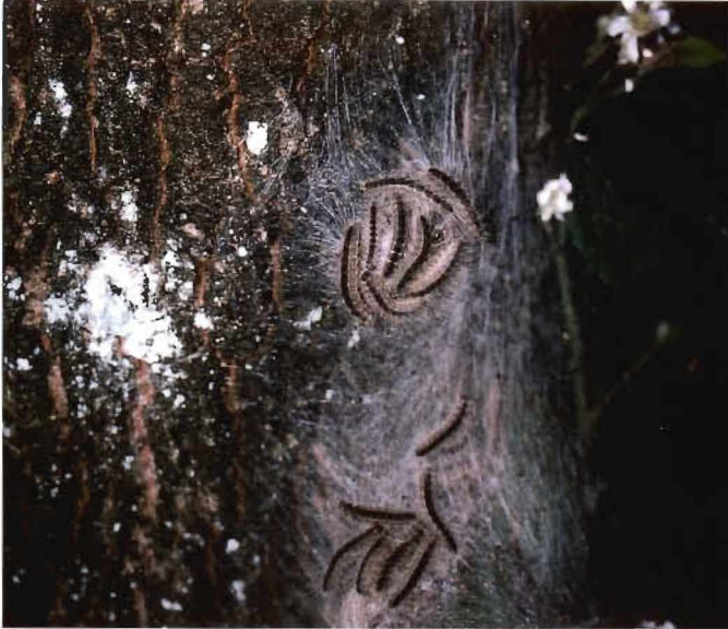
Abb. 5: Nest von Thaumetopoea processionea (LINNAEUS, 1758), Wankumer Heide/Niederrhein am 23.06.2002