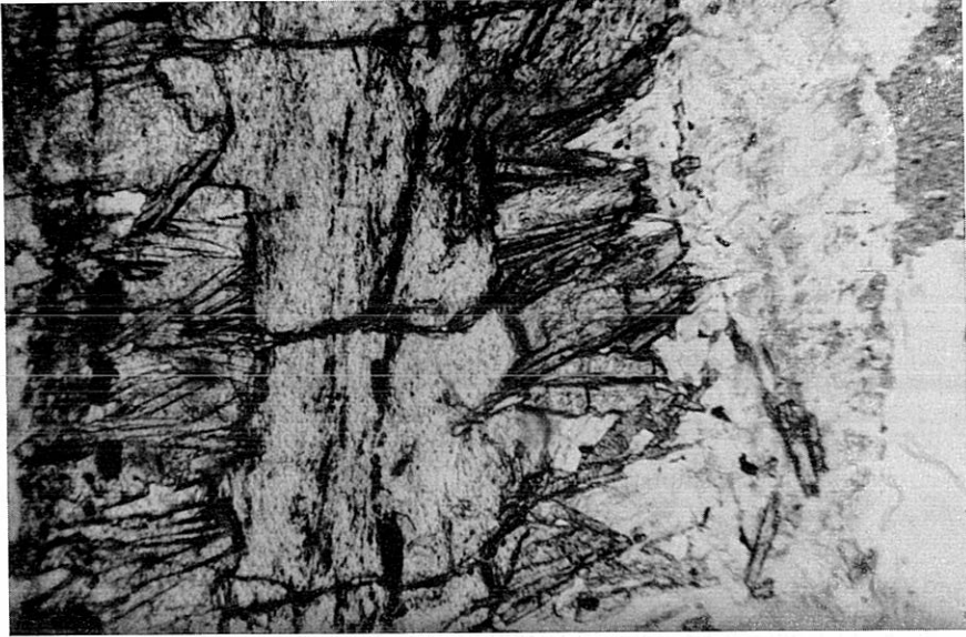
Abb. 2: Glimmerschiefer Ramolhaus: Saum von Chloritoid um Staurolith.