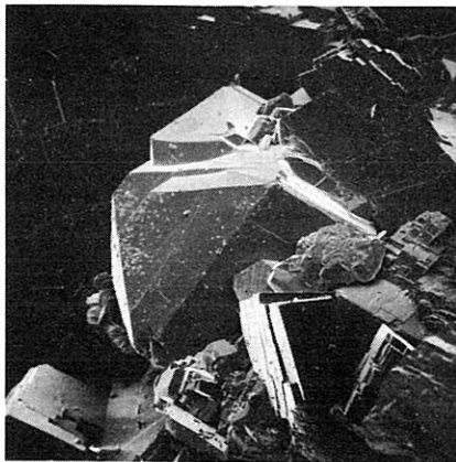
Abb. 1 REM-Aufnahme von Xenotim vom Steirischen Erzberg; Vergrößerung 55 ×.

An dieser Stelle sei noch auf einen weiteren neuen Mineralfund vom Steirischen Erzberg hingewiesen. Aus obigem Probenmaterial konnte, auf Kupferkies aufgewachsen, ein feinst-nadeliges Erzmineral vorläufig als Bismuthinit bestimmt werden (NIEDERMAJR et al., 1983).