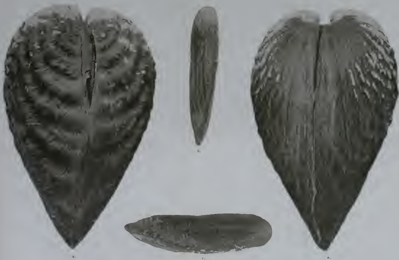
a. Quadrulus Liedtkei Rolle. b. Unio gracilimus Rolle. c. Unio Fruhstorferi Dautz.