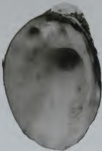
Quadrulus Liedtkei Rolle, Tonkin.