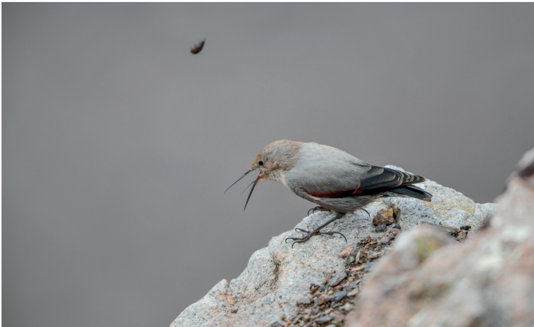
Abb. 9: Regelmäßig werden die unverdaulichen Chitinbestandteile der Nahrung als Speiballen ausgeworfen. Aufnahme: 03.02.2013.