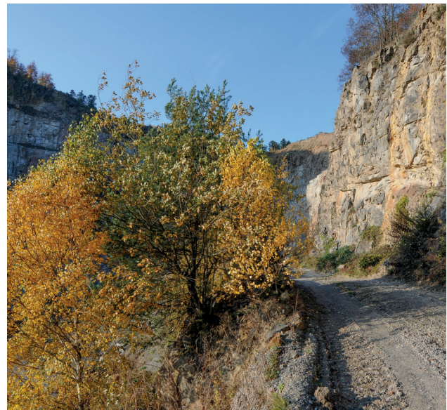
Abb. 2: Herbstliche Stimmung in einem Steinbruch im Schwarzwald. Zu dieser Zeit treffen Mauerläufer in ihren Winterhabitaten in Baden-Württemberg ein. Aufnahme: 01.11.2011.

Es wurden 16 geologische Aufschlüsse und zwei natürliche Felsvorkommen überwiegend im nördlichen Schwarzwald und am nordwestlichen Schwarzwaldrand in den Wintern 2010/11 bis 2013/14 regelmäßig, jedoch unterschiedlich häufig begangen, um Mauerläufer nachzuweisen. Größere Steinbrüche wurden nach Negativkontrollen mehrmals aufgesucht, um Nachweisfehler zu vermeiden. – Da einige Steinbrüche sich (wieder) in Betrieb und in Privatbesitz befinden, mussten Betretungserlaubnisse eingeholt werden, wofür der Autor sich auch an dieser Stelle bedankt. In Betrieb befindliche Steinbrüche wurden wegen ihrer Gefährlich-