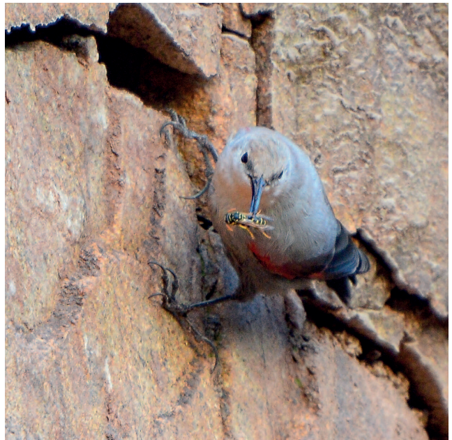
Abb. 5 bis 8: Unterschiedliches Nahrungsspektrum im Winterquartier (von oben links nach unten rechts): Sackspinne ( Clubionidae ), Baumwanze ( Pentatomidae ), Taubenschwänzchen ( Macroglossum ) und Faltenwespe ( Vespidae ). Allerdings wurde die Wespe nach langem Zögern verworfen. Aufnahmen von oben links nach unten rechts: 23.02.2013, 31.12.2012, 10.03.2013, 30.11.2013.