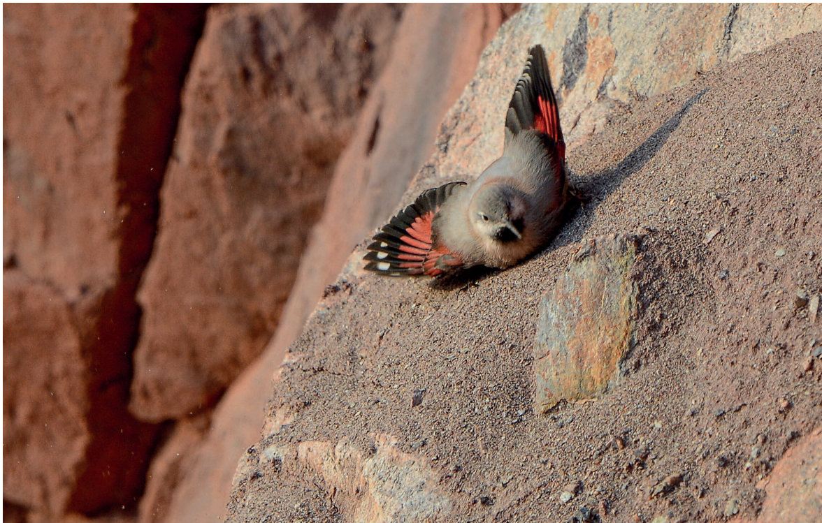
Abb. 3: Mauerläufer beim „Sandbaden“ auf einer Felskante in einem sich in Betrieb befindlichen Steinbruch. Links sind weggeschleuderte Gruskörner zu erkennen. Aufnahme: 16.03.2014.