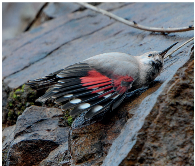
Abb. 10 und 11: Mauerläufer im Schlichtkleid mit reinweißer Kehle bei Ankunft im Winterquartier und mausernd ins Brutkleid mit Schwärzung der Kehle am Ende der Überwinterung. Aufnahmen: 20.11.2011 und 10.03.2013.