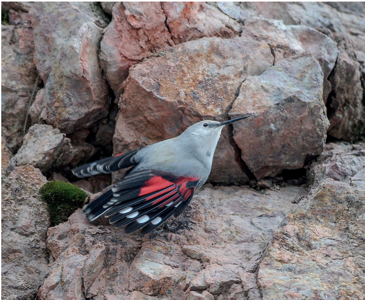
Abb. 1: Mauerläufer ( Tichodroma muraria) im Schlichtkleid in einem Steinbruch des Nordschwarzwaldes. Aufnahme: 23.01.2011.

Keywords: Wallcreeper, Tichodroma muraria , winter visitor, habitat in wintertime, quarry, quality of habitat, time of presence, foraging, winter plumage, behaviour, Baden-Württemberg, Black Forest.