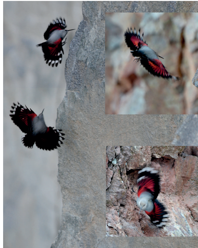
Abb. 14: Mit seinen breiten, runden Flügeln kann der Mauerläufer dicht an der Felswand ohne anzustoßen „auf- und absteigen“. Aufnahmen: Januar 2011 und November 2013, Fotokollage.