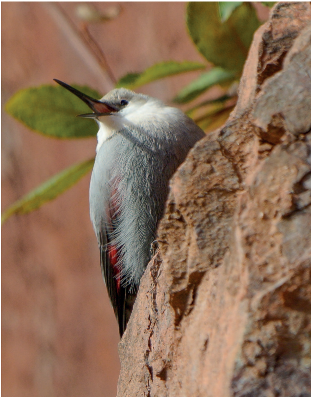
Abb. 13: Mauerläufer sind im Winterquartier meistens stumm, lassen aber gelegentlich einen unterdrückten Teilgesang (Subsong) hören. Aufnahme: 01.11.2013.