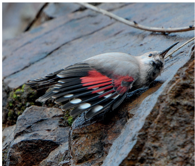
Abb. 10 und 11: Mauerläufer im Schlichtkleid mit reinweißer Kehle bei Ankunft im Winterquartier und mausernd ins Brutkleid mit Schwärzung der Kehle am Ende der Überwinterung. Aufnahmen: 20.11.2011 und 10.03.2013.