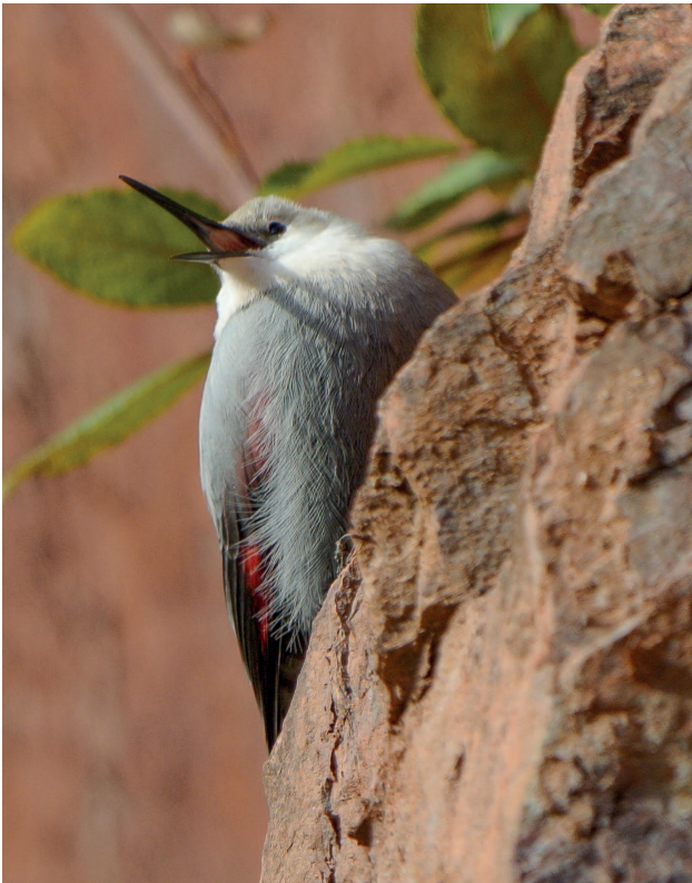
Abb. 13: Mauerläufer sind im Winterquartier meistens stumm, lassen aber gelegentlich einen unterdrückten Teilgesang (Subsong) hören. Aufnahme: 01.11.2013.