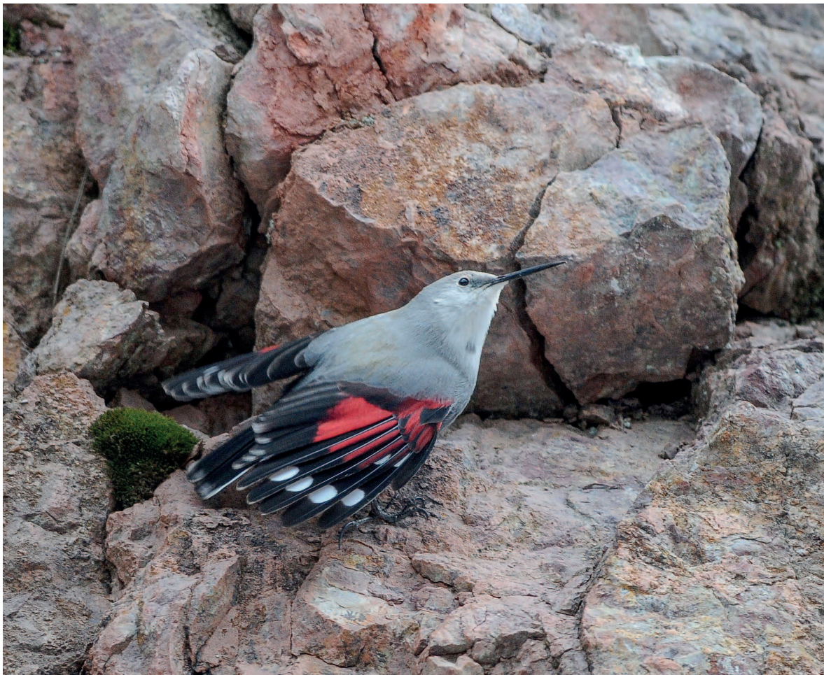
Abb. 1: Mauerläufer ( Tichodroma muraria) im Schlichtkleid in einem Steinbruch des Nordschwarzwaldes. Aufnahme: 23.01.2011.

Keywords: Wallcreeper, Tichodroma muraria , winter visitor, habitat in wintertime, quarry, quality of habitat, time of presence, foraging, winter plumage, behaviour, Baden-Württemberg, Black Forest.