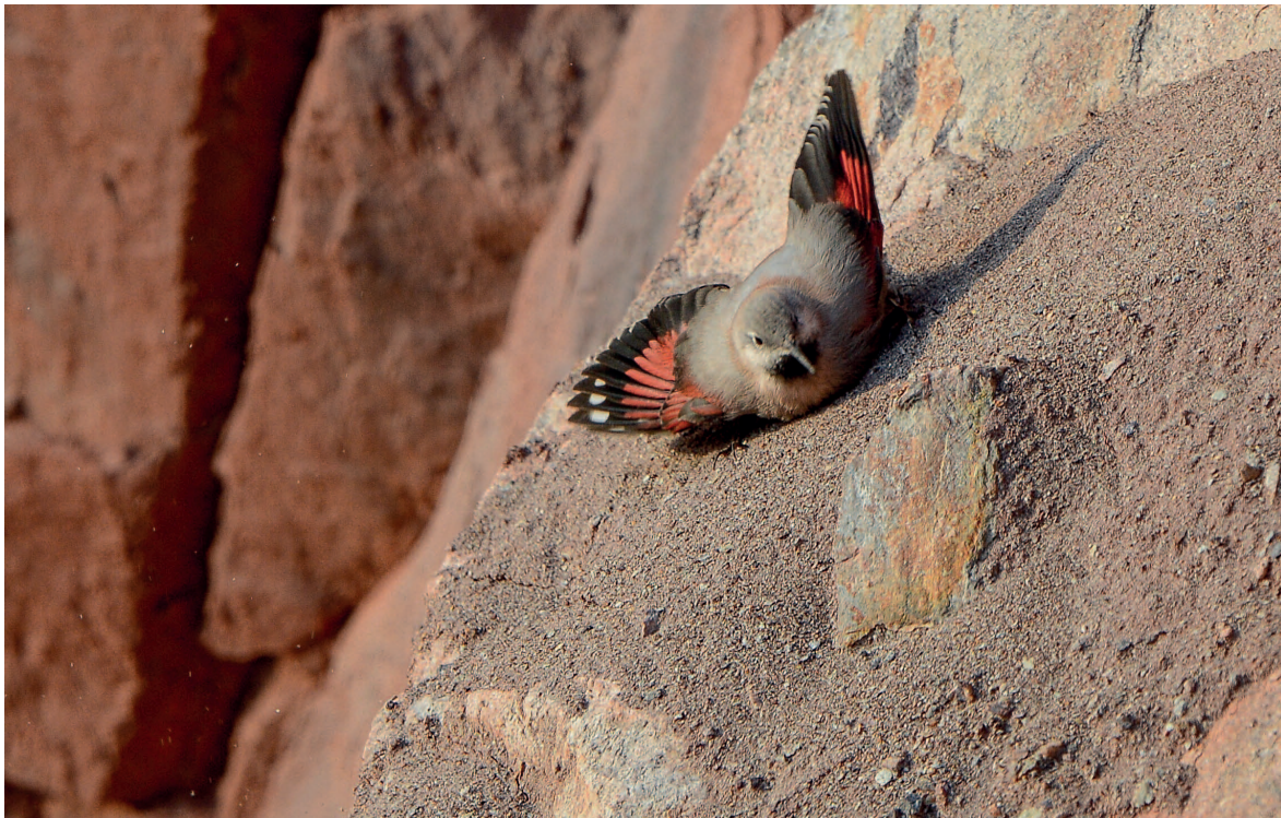
Abb. 3: Mauerläufer beim „Sandbaden“ auf einer Felskante in einem sich in Betrieb befindlichen Steinbruch. Links sind weggeschleuderte Gruskörner zu erkennen. Aufnahme: 16.03.2014.