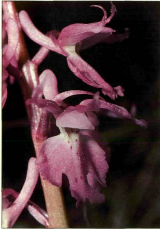
Abb. 7: Von unseren Knabenkräutern im engeren Sinn ( Orchis sp. ) war von jeher nur das Stattliche Knabenkraut ( Orchis masculula ) auch in den Kristallingebieten des Mühlviertels und des Sauwaldes verbreitet. Auf moosigen Böschungen einsamer Täler kann man ihm dort auch heute noch ab und zu begegnen. Ein viel häufigerer Anblick sind seine purpurroten Blütenähren aber auf den Bergwiesen unserer Alpen (Mühlviertel: Waldaistal; 1978).