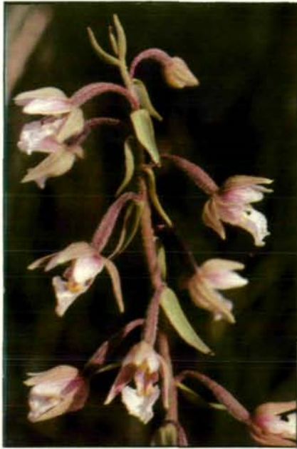
Abb. 13: Der Echte Sumpfstendel ( Epiactis palustris ) teilt das traurige Schicksal vieler anderer Flachmoorpflanzen unserer Heimat. Einerseits wird ihm durch Entwässerungsmaßnahmen allenthalben im wahrsten Sinn des Wortes das Wasser abgegraben, andererseits bewirkt die allgemeine Eutrophierung unserer Umwelt, verursacht vor allem durch den hohen Düngereinsatz auf unseren Feldern und Wiesen sowie die teilweise katastrophale Verschmutzung unserer Flüsse, oft tiefgreifende Biotopveränderungen. Überall nehmen mastige, hochwüchsige Stauden überhand. Für die ursprünglichen Flachmoorbewohner bleibt immer weniger Platz (Schweiz: Hallwieler See; 1980).

neren oder etwas nährstoffreicheren Biotopen vorlieb nehmen, außerdem weniger wärmebedürftig und daher nicht an Tieflagen gebunden sind, konnten sich bei uns zumindest im Alpenbereich vorläufig noch gut behaupten. Dazu gehören das Gefleckte Knabenkraut ( Dactylorhiza maculata ), das Breitblättrige Knabenkraut ( Dactylorhiza majalis , Abb. 14) und die Große Händelwurz ( Gymnadenia conopsea ). Um Linz, besonders aber auf den Bergwiesen des benachbarten Mühlviertels, zählten diese drei Arten früher zu den häufigsten Gewächsen. Heute ist allerdings davon nichts mehr zu bemerken. Nur noch selten leuchten die purpurroten Blütenähren des Breitblättrigen Knabenkrautes aus dem frischen Grün mooriger Wiesenflecken. Man braucht schon viel Glück, um sogar noch an quelligen Stellen entlegener Pfenningbergwiesen über die letzten Exemplare dieser dort einst so verbreiteten Knabenkrautart zu stolpern. Kleinere Kolonien der Großen