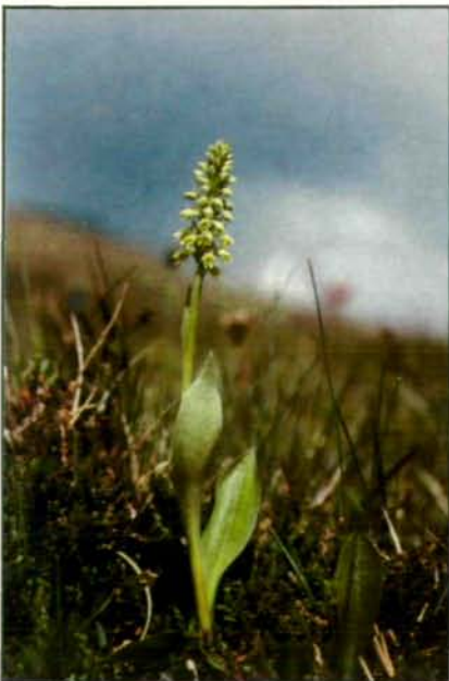
Abb. 5: Höswurz ( Leucorchis albida ). In den bodensauren, nährstoffarmen Bürstlingsrasen unserer Alpen sind die gelblichweißen Blütentrauben dieser ziemlich unscheinbaren Orchidee noch ein durchaus häufiger Anblick. Sie steigt dort oft weit über die Waldgrenze empor. Im Mühlviertel allerdings beschränkt sich ihr Vorkommen heute bereits auf wenige Fundstellen in den höchsten Lagen des Böhmerwaldes (Kärnten: Zirbitzkogel; 1986).

Diese traurige Tendenz, sich immer mehr in die Voralpengebiete unseres Bundeslandes zurückzuziehen, läßt sich auch bei einer Reihe von anderen Magergrasorchideen beobachten. Beispielsweise kam eine der Zierden unserer Alpenwiesen, die hübsche Kugelorchis ( Trausteinera globosa ), nach STEINWENDTNER (1981) als botanische Rarität einst sogar im Bereich des Kürnberger Waldes vor. Auch die viel unscheinbarere grünlichgelb blühende Einknolle ( Herminium monorchis ) und