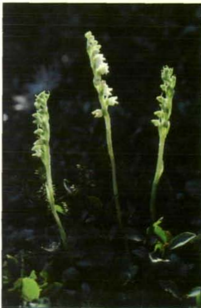
Abb. 18: Auch das ist eine Orchidee! Die recht unscheinbaren weißen Blütenähren des Kriechenden Netzblattes ( Goodyera repens ) verraten nur dem Kundigen die vornehme Abstammung dieses Pflänzchens. Vermutlich auch oft übersehen, fristet es in sandigen Nadelwäldern sein verstecktes Dasein. Unsere lichtleeren Fichtenplantagen sind aber offensichtlich nicht der geeignete Lebensraum, denn außerhalb der Alpen scheint diese Art weitgehend verschwunden zu sein (Niederösterreich: Schneeberg; 1981).

hend auf entsprechende Standorte in unseren Alpentälern zurückgezogen hat. In sehr feuchten, moosigen Wäldern wiederum gedieh als große Seltenheit das unscheinbar grüngelb blühende Einblatt ( Malaxis monophyllos ) und die weißen, nicht minder unauffälligen Blütenähren des Netzblattes ( Goodyera repens , Abb. 18) waren auch schon damals nur in wenigen, sandig-moosigen und dabei lichten Nadelwäldern zu entdecken. Interessanterweise ist nicht einmal diese, von vornherein an Nadelwälder angepaßte Art durch die großflächige Umwandlung unserer Laub- und Mischwälder in eintönige Fichtenplantagen gefördert worden. Ganz im Gegenteil! Auch das Netzblatt wurde weitgehend ins Alpengebiet zurückgedrängt. Das gleiche gilt für das winzige und noch dazu recht unscheinbar blühende Herz-Zweiblatt ( Listera cordata ), einem Bewohner der weichen, stets feuchten Torfmoospolster uriger Fichtenwälder. Früher noch von mehreren Stellen in den Hochlagen des Mühlviertels bekannt, unter anderem auch vom Lichtenberg, wurde dieser Orchideenzweig seit 1930 nirgendwo au-