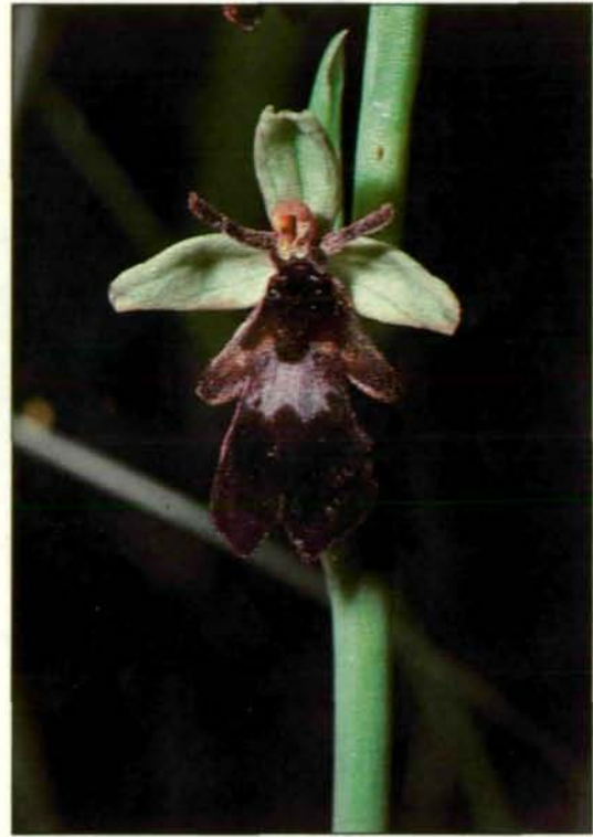
Abb. 8: Fliegen-Ragwurz ( Ophrys insectifera ). Die Blüten unserer Ragwurz-Arten ahmen sowohl in Farbe, Gestalt und Behaarung der Lippe aus auch durch die von ihnen abgegebenen Sexuallockstoffe die Weibchen bestimmter Bienen- oder Hummelarten täuschend nach. Auf diese Weise angelockte Freier männlichen Geschlechts übertragen bei ihren Kopulationsversuchen dann am Körper haften gebliebene Pollenpakete und sorgen auf diese seltsame Art für die Bestäubung. Abgesehen vom Alpengebiet ist die Fliegen-Ragwurz bei uns nur noch entlang der Traun zu finden (Kärnten: Tscheppa-Schlucht in den Karawanken; 1980).