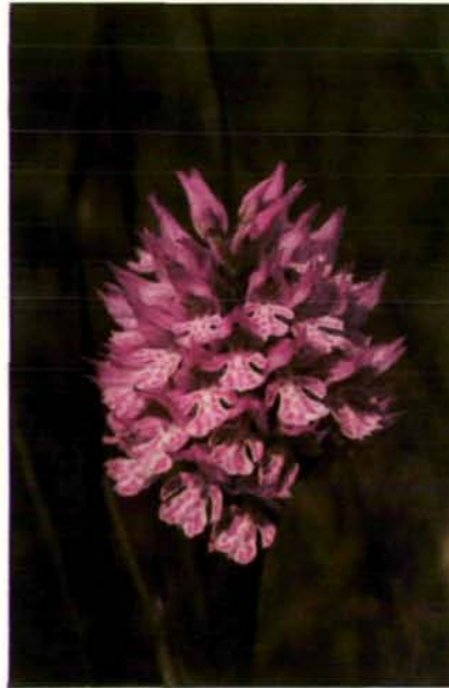
Abb. 10. Auf weißem Grund weinrot gepunktet sind die hübschen Blüten des Dreizähligen Knabenkrautes ( Orchis tridentata ). Diese Art ist besonders wärmeliebend und fehlt daher in unseren Alpentälern. Ihre bevorzugten Standorte – Kalkmagerrasen niedriger Lagen – sind heute weitgehend vernichtet, wodurch diese Pflanze in Oberösterreich sehr selten geworden ist (Oberösterreich: am Luftenberg bei Abwinden; 1984).