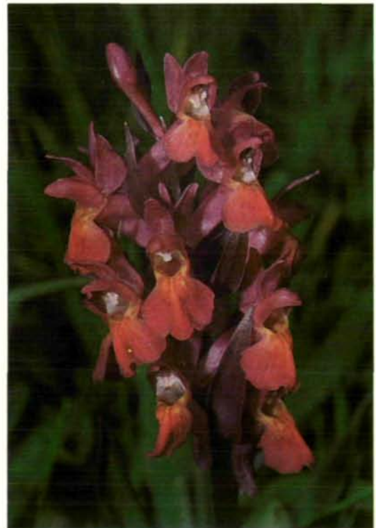
Abb. 11: Beim Holunder-Knabenkraut ( Dactylorhiza sambucina ) kommen fast immer rote und gelbe Pflanzen nebeneinander vor. Im Gegensatz zu den meisten anderen heimischen Magerwiesenorchideen bevorzugt es kalkarmen Boden. In Oberösterreich kann man seine äußerst farbenprächtigen Blüten nur mehr in der Umgebung von Steyr zu Gesicht bekommen, und auch dort werden die letzten Populationen durch Aufforstung weiter dezimiert (Italien: am Monte Baldo im Trentino; 1984).