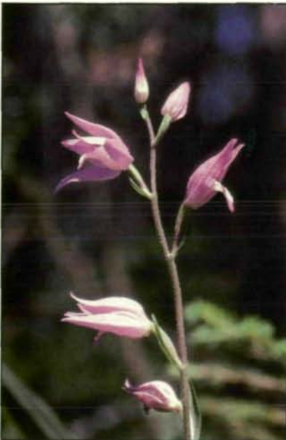
Abb. 16: Aus dem Waldesdunkel leuchten uns die hübschen Blüten des Roten Waldvögleins ( Cephalanthera rubra ) entgegen. Wie seine beiden weißblühenden Verwandten fühlt es sich in Kalkbuchenwäldern oder ähnlichen Waldtypen am wohlsten. In den Kalkalpen finden sich solche Standorte noch in großer Zahl, im Zentralraum sind sie dagegen bereits selten geworden. Von dort dürfte sich diese seltenste unserer Waldvöglein-Arten übrigens auch schon endgültig verabschiedet haben. (Kärnten: bei Weißenstein im Drautal; 1978.)

Unter den verschiedenen Waldtypen unserer Breiten waren seit jeher warme Laubwälder auf kalkreicher Unterlage für ihren Orchideenreichtum