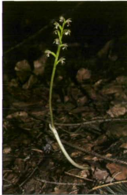
Abb. 2: Die unscheinbare und bleiche Korallenwurz ( Corallorhiza trifida ) gehört zu den heimischen Orchideen, die sich zu ihrer Ernährung ganz auf die Ausnutzung ihres Wurzelpilzes spezialisiert haben und daher keine grünen Blätter mehr entwickeln. Früher sogar aus der nächsten Linzer Umgebung bekannt, ist ihr Vorkommen in Oberösterreich heute ganz auf Bergwälder des Alpengebietes beschränkt (Italien: Julische Alpen beim Passo di Nevea; 1984).

Jahre. Einige unserer heimischen Orchideen haben die Zusammenarbeit mit ihrem Wurzelpilz sogar derart auf die Spitze getrieben, daß sie auf die Ausbildung eigener grüner Blätter vollkommen verzichten. Der normalen Energiequelle von Blütenpflanzen, nämlich der Ausnutzung des Sonnenlichtes durch die Photosynthese beraubt, widmen sich diese farblosen Gesellen nun ganz der Ausnutzung ihres Wurzelpilzes. Nur mehr ein Blütenstand mit schuppenförmigen, chlorophyllfreien und daher bleichen Blattresten verrät uns ihre Anwesenheit. Auf diese Art haben sie sich eine für höhere Pflanzen völlig neue Energiequelle erschlossen, nämlich die in schattigen Wäldern oft überreichlich vorkommenden vermoderten Teile anderer Pflanzen. Zu diesen Moderorchideen gehört die im Alpengebiet Oberösterreichs noch recht häufige Nestwurz ( Neottia nidus-avis ), die seltene, kleinere Korallenwurz ( Corallorhiza trifida , Abb. 2) sowie – als ausgesprochene Rarität unserer Gebirgsfichtenwälder – der gelblich-weiße Widerbart ( Epipogium aphyllum ). Sie alle vermögen auch im tiefen Schatten humusreicher Wälder noch zu gedeihen, eine für Blütenpflanzen wahrhaft alternative Lebensweise.