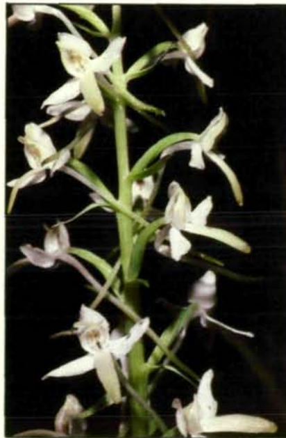
Abb. 1: Nur entsprechend langrüsselige Nachtfalter sind imstande, aus den abenteuerlich lang bespornten Blüten der Weißen Waldhyazinthe ( Palanthera bifolia ) Nektar zu saugen und sie dabei zu bestäuben. Im Gegensatz zu den meisten anderen Orchideen ist diese Art ziemlich anpassungsfähig, gedeiht in lichten Wäldern auch über kalkarmem Boden und kann daher gelegentlich auch noch außerhalb des Alpengebietes, beispielsweise im Mühlviertel, angetroffen werden (Kärnten: beim Weißensee; 1978).

Besonders der schier unerschöpfliche Phantasie-reichtum, mit dem die Natur die Orchideenblüten an ihre jeweiligen Bestäuber aus den unterschiedlichsten Insektengruppen angepaßt hat, versetzt auch abgebrühte Profibotaniker immer wieder in höchste Bewunderung. Von grazilen Nachtfalterblumen mit mehreren Zentimeter langen, dabei aber faden-dünnen, nektarhaltigen Sporen bei unseren beiden Waldhyazinthen ( Platanthera , Abb. 1) über die raffinierte Kesselfallenblume des Frauenschuhs ( Cypripedium calceolus , Abb. 12) bis zu den extremen Täuschblüten der Ragwurz-Arten ( Ophrys sp., Abb. 6) spannt sich auch bei den heimischen Orchideen der Bogen von Spezialanpassungen an ihre Bestäuber. In aller Herren Ländern sind daher schon von alters her die Botaniker dem Zauber dieser so unerhört formen- und oft auch farbenprächtigen Pflanzenfamilie erlegen. Vergleichsweise häufig tauchen deshalb auch in alten oberösterreichischen Florenwerken Angaben über die damalige Verbreitung der verschiedenen Arten auf. Schon aus diesem Grund bieten sich die Orchi-