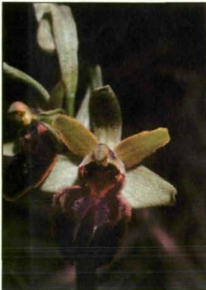
Abb. 3: Um derart exotische Blütenwunder zu entdecken, war um die Jahrhundertwende keineswegs ein teurer „Abenteuerurlaub“ in einem tropischen Regenwald vonnöten. Ein gemütlicher Familienausflug in die Welser-Heide tat es auch. Dort konnte man damals vor den Toren der Stadt die ungewöhnlichen Täuschblumen der Spinnen-Ragwurz ( Ophrys sphecodes ) bewundern, welche auf Grund ihrer bienenartig pelzigen Unterlippe von liebeströhlenden Männchen der Sandbienen ( Andrena sp.) angefliegen und bestäubt wurden (vgl. auch Abb. 8). Diese Ragwurzart ist inzwischen völlig aus unserem Bundesland verschwunden. In einigen Magerrasen im Osten Österreichs kann man sie aber auch heute noch antreffen. Die recht ähnliche Hummel-Ragwurz ( Ophrys holosericea ) allerdings hat – allen Biotopvernichtungsaktionen zum Trotz – bis heute an einigen Reststandorten in der Welser Umgebung ausgeharrt (Burgenland; Apetlon; 1980).

In der Folge begannen auch damals durchaus weiter verbreitete Arten vor dem Ansturm der Kunstdüngerstreuer und Baumaschinen in die Knie zu gehen. Ein geradezu klassisches Beispiel dafür liefert uns das nach dem unangenehmen Geruch seiner Blüten benannte Wanzen-Knabenkraut ( Orchis coriophora ). Diese hübsche Orchidee war in frischen, ungedüngten Wiesen dereinst in ganz Mitteleuropa verbreitet und auch bei uns durchaus keine extreme Seltenheit. Im Gebiet der heutigen DDR gab es nach SUNDERMANN (1980) früher beispielsweise über 300 Fundorte. Nun wurden aber gerade solche, von der Wasserversorgung her recht günstige Wiesentypen als