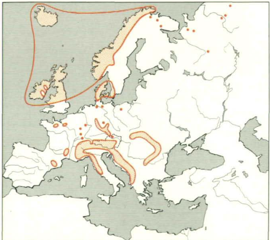
○ Verbreitungsgebiet ● Einzelvorkommen