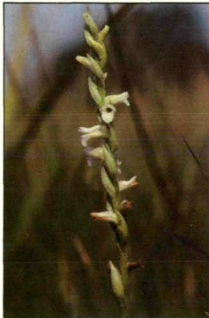
Abb. 12. Die unscheinbar weißen Blüten der Sommer-Drehähre ( Spiranthes aestivalis ) sehen so gar nicht orchideenartig aus. Schon aus diesem Grund hat diese Pflanze wohl nie unter den Nachstellungen des Menschen gelitten. Daß sie im außeralpinen Teil Oberösterreichs trotzdem seit langem ausgestorben ist, geht demnach ausschließlich auf die völlige Vernichtung entsprechender Flachmoorstandorte zurück (Schweiz: Hallwieler See; 1980).

Bisher hat nur das ausgesprochen dekorative, rotblühende Sumpfk-Knabenkraut ( Orchis palustris ) unserem Bundesland endgültig den Rücken gekehrt. Schon im vorigen Jahrhundert war es äußerst selten, und die von ihm besiedelten Moor- und Binsenwiesen tieferer Lagen gehörten wohl zu den ersten Feuchtbiotopen, die entwässert und in landwirtschaftliche Kulturfächen umgewandelt wurden. Die nächsten Aussterbekandidaten scheinen aber bereits vorprogrammiert zu sein. Zu ihnen gehören Arten mit sehr engen ökologischen Ansprüchen wie die unscheinbare, im wesentlichen an kalkhaltige Flachmoorwiesen gebundene Sommer-Drehähre ( Spiranthes aestivalis , Abb. 12). Aus dem Zentralraum ist diese Pflanze schon lange verschwunden, und die Zahl der restlichen Fundorte in Oberösterreich nach 1930 läßt sich an wenigen Fin-