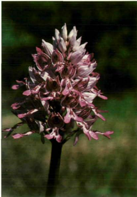
Abb. 9: In der Schönheit von Farbe und Form seiner zahlreichen Blüten braucht das Helm-Knabenkraut ( Orchis militaris ) einen Vergleich mit seinen tropischen Verwandten wohl nicht zu scheuen. Früher in Kalkmagerrasen wärmerer Lagen weiter verbreitet hat sich diese Orchideenschönheit bei uns weitgehend in Auengebiete zurückgezogen (Wien: Lobau; 1981).