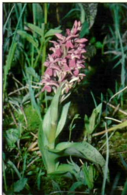
Abb. 14: Das Breitblättrige Knabenkraut ( Dactylorhiza majalis ) findet schon mit kleinen, moorigen Wiesenflecken sein Auslangen und scheint auch Düngung etwas besser zu vertragen als der Rest seiner diesbezüglich äußerst empfindlichen Verwandtschaft. In den bodensauren Gebieten des Mühlviertels und des Sauwaldes ist es aus diesen Gründen unsere „häufigste“ Orchidee. Recht charakteristisch für diese purpurrot blühende Art sind die meist auffallend dunkel gefleckten Blätter, wie man sie bei uns sonst nur noch beim ähnlichen Gefleckten Knabenkraut ( Dactylorhiza maculata ) antrifft (Mühlviertel: Waldaistal; 1978).

Schon aus dieser kurzen Zusammenstellung läßt sich unschwer ablesen, daß auch die Orchideen unserer Feuchtbiootope einen letztendlich aussichtslosen Kampf gegen die zu-