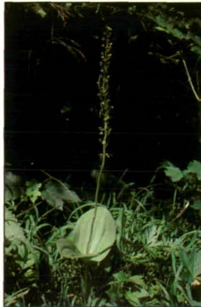
Abb. 19: Das Große Zweiblatt ( Listera ovata ) gehört zu unseren anpassungsfähigsten und häufigsten Orchideen. Seine langen, grünlichen Blütenähren sind sowohl in feuchten, nährstoffreichen Laubwäldern als auch in nicht allzu intensiv bewirtschafteten Mähwiesen zu finden. Der Hauptgrund dafür scheint in der für Orchideen außerordentlich hohen Düngeresistenz dieser Art zu liegen. Auf Grund seiner Vorliebe für kalkreiche Böden ist das Große Zweiblatt im Mühlviertel allerdings ausgesprochen selten. Bei den mir von dort bekannt gewordenen Fundorten handelt es sich fast durchwegs um ungedüngte, extensiv bewirtschaftete Bürstlingsrasen (z. B. im Böhmerwald und am Lichtenberg). (Steiermark: Salzatal bei Wildalpen; 1986)

Berhalb der Alpen je wieder gefunden. Am Beispiel dieser drei sehr unscheinbaren und sicher niemals durch direkte menschliche Nachstellungen gefährdeten Kleinorchideen wird uns noch einmal eindringlich vor Augen geführt, wie empfindlich diese Gewächse schon auf geringfügige Änderungen ihres Lebensraumes reagieren. Angepaßt an ursprüngliche, sehr naturnah bewirtschaftete Nadelwaldtypen mit entsprechend günstigen Humus- und Lichtbedingungen reicht in vielen Fällen schon eine Änderung der Bewirtschaftungsform zur gleichaltrigen Fichtenmonokultur, um diesen Arten die Existenzgrundlage zu entziehen.