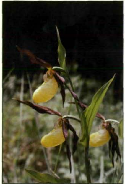
Abb. 17: Der Frauenschuh ( Cypripedium calceolus ) war seit alters her die „Paradeorchidee“ unserer Heimat. Seine fremdartig exotisch anmutenden Blütenwunder vermitteln uns eine gewisse Ahnung von der unglaublichen Formenvielfalt dieser Pflanzenfamilie in den Tropen. Daneben gehören diese Kesselfallenblüten des Frauenschuh auch zu den raffiniertesten Erfindungen, denen wir im Pflanzenreich begegnen können. Anfliegende Bienen rutschen nämlich am schlüpfrigen Rand der gelben Unterlippe unweigerlich aus und purzeln Hals über Kopf ins Innere des „Pantoffels“. Im Verlauf ihrer ziellosen Suche zurück in die Freiheit weisen ihnen durchsichtige und daher helle Wandstellen den Weg zu den beiden Ausgängen, bei deren Passage sie sowohl die Staubblätter als auch die Narbe des Stempels passieren müssen. Für den dramatischen Rückgang dieser Orchidee hat zweifellos Pflücken und Ausgraben durch gedankenlose Zeitgenossen ebenfalls eine gewisse Rolle gespielt (Kärnten: St. Pauler Berge; 1980).

sollte deswegen aber keineswegs unterschätzt werden. In diesem Zusammenhang sei nur auf den rücksichtslosen Güterwegbau entlang unserer Gebirgsbäche hingewiesen, nach STEINWENDTNER (1981) die bevorzugten Standorte dieser schon lange vollständig geschützten Pflanze.