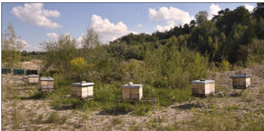
Abb. 16: Die Flora der Schottergruben ist so vielseitig und blütenreich, dass die Imkerinnen und Imker heute gerne ihre Bienenkästen hineinstellen.

der Artenvielfalt, egal, ob heimisch oder fremd. In etwas größeren bzw. älteren Gruben oder Steinbrüchen mit entsprechendem Hinterland findet man übers Jahr locker an die zweihundert Pflanzenarten. Da ist für jedes Tier und jede Botanikerin bzw. jeden Botaniker etwas dabei. Das riesige, vielfältige Blütenangebot nützen inzwischen auch viele Imkerinnen und Imker, die ihre Bienenstöcke in Schotter- und Sandgruben einstellen (Abb. 16). Nicht zu vergessen sind die Unmengen an Samen, die den Vögeln auf solchen Flächen durch die vielen Disteln und Karden zur Verfügung stehen, und Möglichkeiten zum Überwintern von Insekten findet man dort en masse (Abb. 17). Die berühmte „Gstätt“ feiert an diesen Plätzen fröhliche Urständ. Pflanz’ und Tier sind für einige Jahre in Partystimmung!