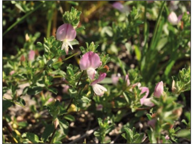
Abb. 6: Größere Bestände der Kriech-Hauhechel ( Ononis repens ) – eine stark gefährdete Art der oberösterreichischen Flora – können vor allem in alten Schottergruben gefunden werden.

es Schotterflächen an den Flüssen nur mehr wenig gibt. Ähnlich geht es auch der Schwarz-Pappel ( Populus nigra ), die in den Schottergruben oft zu Hunderten hoffnungsfroh keimt, an diesen Stätten aber chancenlos ist, in Würde alt zu werden.