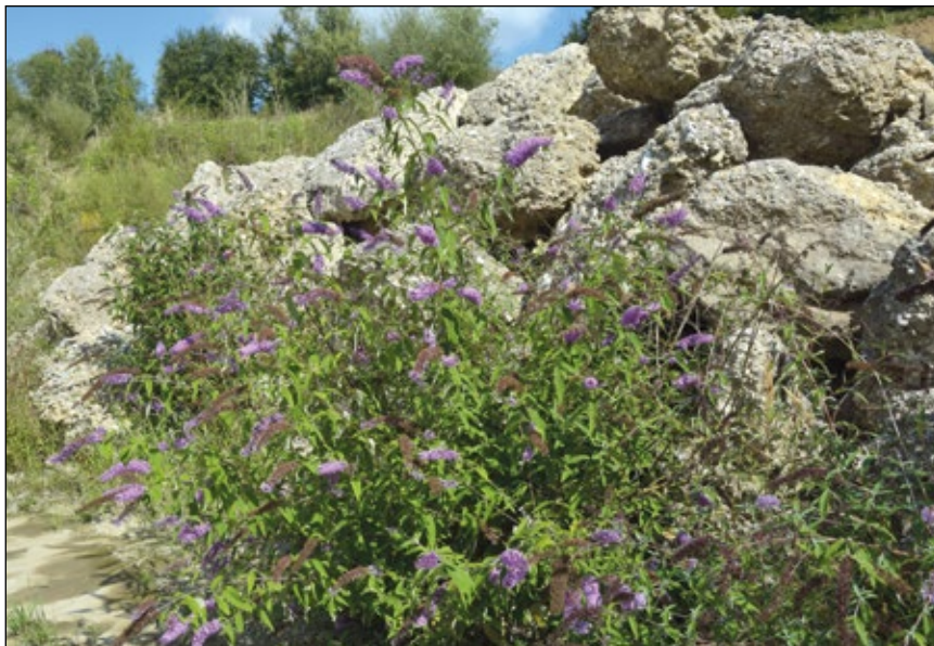
Abb. 15: Gerne in Schottergruben und Steinbrüchen – der aus China stammende Gewöhnliche Sommerflieder ( Buddleja davidii ) – ein Schmetterlingsmagnet sondergleichen – hier in einer Schottergrube nahe Gilgenberg am Weillhart

Die großen Ruderalflächen in Abbaugeländen sind generell Hotspots