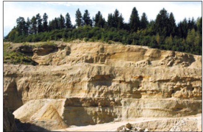
Abb. 2: Große Schottergrube in Wagenham/Pischelsdorf am Engelbach – Homo fodens arbeitet sich Etage für Etage in die Tiefe.

Schon seit Jahrtausenden gräbt und wühlt der Mensch in der Erde. Er sucht unablässig nach Metallen, Mineralien, Salzen, Energieträgern, Baustoffen und hinterlässt Löcher in der Landschaft ... Genau diese Öffnungen des Bodens schaffen Habitate für viele Organismen, die es wert sind, genauer hinzusehen. In diesem Kapitel werden Beispiele von Pflanzen vorgestellt, die exakt diese Lebensräume benötigen, um sich in der wachsenden Monotonie unserer Landschaft halten zu können.