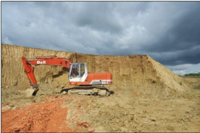
Abb. 1: Lehmgrube nahe Kleinmurham/Weilbach – man schürft hier für die Ziegelproduktion.

Therese-Riggler-Straße 16 A-4982 Obernberg am Inn m.hohla@eduhi.at