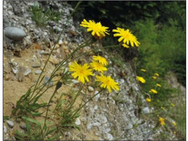
Abb. 9: Das Grasnelkenhabichtskraut ( Chlorocrepis staticifolia ) – eine typische Pflanze der Kalkalpen, die es schaffte, in der kleinen Schottergrube bei Titting/Haag am Hausruck zu landen und sie reichlich zu besiedeln.