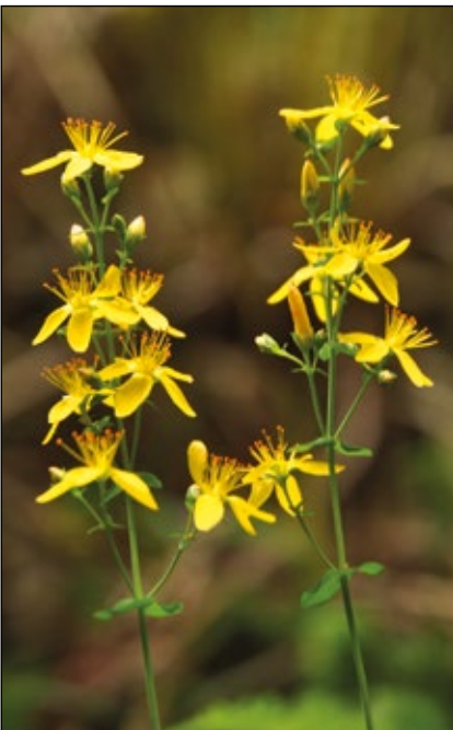
Abb. 7: Das Heide-Johanniskraut ( Hypericum pulchrum ) – eine Art, die in Österreich nur am Westrand des Kobernaußerwaldes und in den Nachbarwäldern vorkommt – braucht offene Böschungen, die an den Rändern der dortigen Waldschottergruben und Forststraßenböschungen zu finden sind.

Eine wichtige Funktion der Abbaustätten ist deren großes Angebot