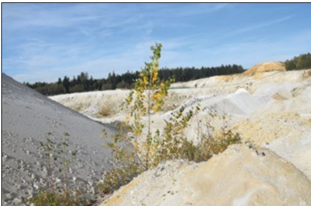
Abb. 3: Quarzsandabbau im Westen von Münzkirchen – Schwarzpappeln ( Populus nigra ) fliegen auf solch offenes Gelände.

Andere Pioniere, wie Weiden, Pappeln, viele Korbblütler oder auch die Weidenröschen besiedeln junge, nackte Schotter- und Sandflächen rasch mit ihren luftigen Flugapparaten (Abb 3). Ein solcher Spezialist ist etwa das Rosmarin-Weidenröschen ( Epilobium dodonaei – Abb. 4), das heute in Oberösterreich vor allem in Schottergruben einen Ersatzlebensraum gefunden hat, nachdem