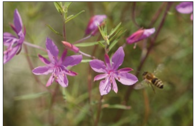
Abb. 4: Das Rosmarin-Weidenröschen ( Epilobium dodonaei ) – kommt in Oberösterreich hauptsächlich in Schottergruben vor – hier in Waldkirchen am Wesen.