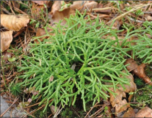
Abb. 5: Die seltenen Flachbärlappe, wie hier der Eigentliche Flachbärlapp ( Diphasiastrum complanatum ), brauchen offene, magere Stellen in den Wäldern, wie sie durch Waldschottergruben oder Waldstraßenböschungen gegeben sind.