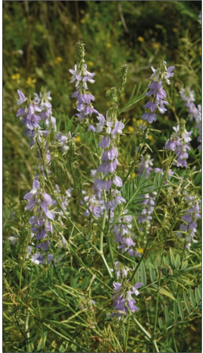
Abb. 14: Die Echte Geißbraute ( Galega officinalis ) – in großen Beständen in einer Ziegelgrube bei Hannesgrub/Tumeltsham