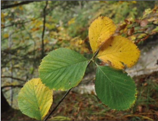
Abb. 8: Die Hügel-Mehlbeere ( Sorbus collina ) – diese Art kommt in Oberösterreich nur an den steilen Salzachhängen vor, vor allem an lückigen Stellen, wo früher Konglomerat (Nagelfluh) abgebaut wurde.