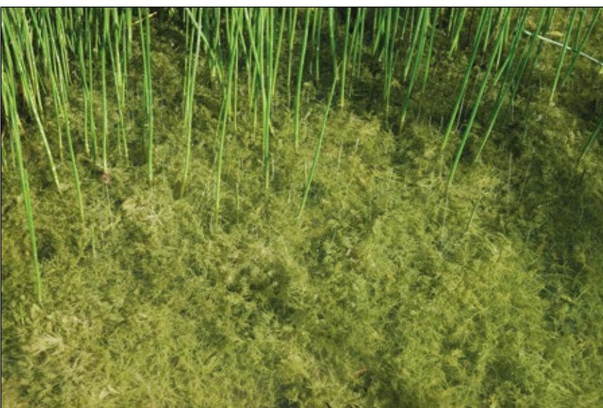
Abb. 13: Die Gewöhnliche Armleuchteralge ( Chara vulgaris ) nutzt kurzfristig vorhandene Kleingewässer – wie hier in einer Seetongrube bei Tarsdorf, gemeinsam mit der Österreichischen Sumpfbirse ( Eleocharis mamillata subsp. austriaca ).

eine solche Chance ebenfalls sehr, sehr lange warten können (HOHLA u. GREGOR 2011). In diesen klaren Teichen und Baggerseen wachsen oft viele Wasserpflanzen (Laichkräuter, Tausendblatt, Wasserhahnenfuß, ...) solange man nicht Fische einsetzt. Gerade nach Karpfenbesatz sind diese Gewässer dann oft rasch trüb und voller Grünalgen. Unter den Wasserpflanzen können sich manchmal auch absolute Raritäten „verstecken“, wie etwa das Glatte Hornblatt ( Ceratophyllum submersum ) im Teich einer Kaolingrube bei Perg (Franz Höglinger in HOHLA u. a. 2009) oder das Knoten-Laichkraut ( Potamogeton nodosus ) im Granitsteinbruch Gopperding (HOHLA 2020).