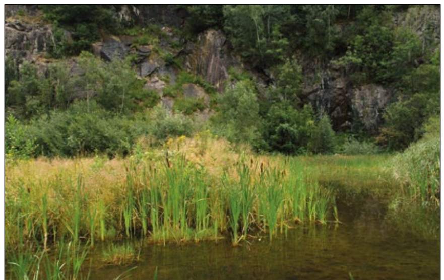
Abb. 11: In den Teichen und Tümpeln in Steinbrüchen herrschen paradisische Zustände für Wasserpflanzen und Amphibien – auf dem Foto zu sehen ist ein längst stillgelegter Steinbruch bei Wernstein am Inn.