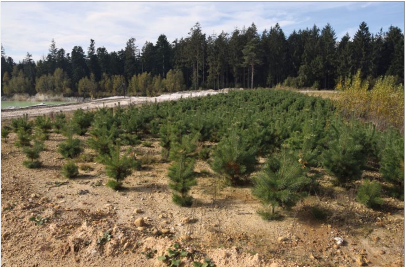
Abb. 18: Leider werden Schotter-, Sand-, Lehmgruben und ähnliche Abbaustätten nach fertigem Abbau oft verfüllt und aufgeforstet. Die Paradiese für Pflanzen und Tiere sind dann verloren.