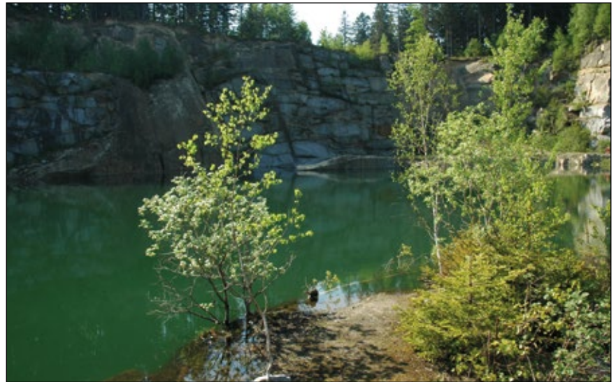
Abb. 10: Alte Steinbrüche sind zauberhaft und zudem wichtige Habitate für Pflanzen und Tiere – besonders reizvoll ist der Steinbruch bei Ach/Kopfung.

In den Schottergruben stößt man jedoch nicht nur auf trockene, magere Lebensräume, sondern auch auf eine unglaubliche Zahl an Tümpeln, Teichen und Seen, vor allem im Hinterland der Gruben (Abb. 10 u. 11). Ein seltener Gast dieser Feuchtlebensräume ist der Silber-Rohrkolben ( Typha shuttleworthii – Abb. 12), der bereits einige Male in Schottergruben gefunden wurde. Kurzlebige Tümpel sind nicht nur für Amphibien und Wasserinsekten ein Highlight, sondern auch für die Armleuchteralgen (Abb. 13), die auf