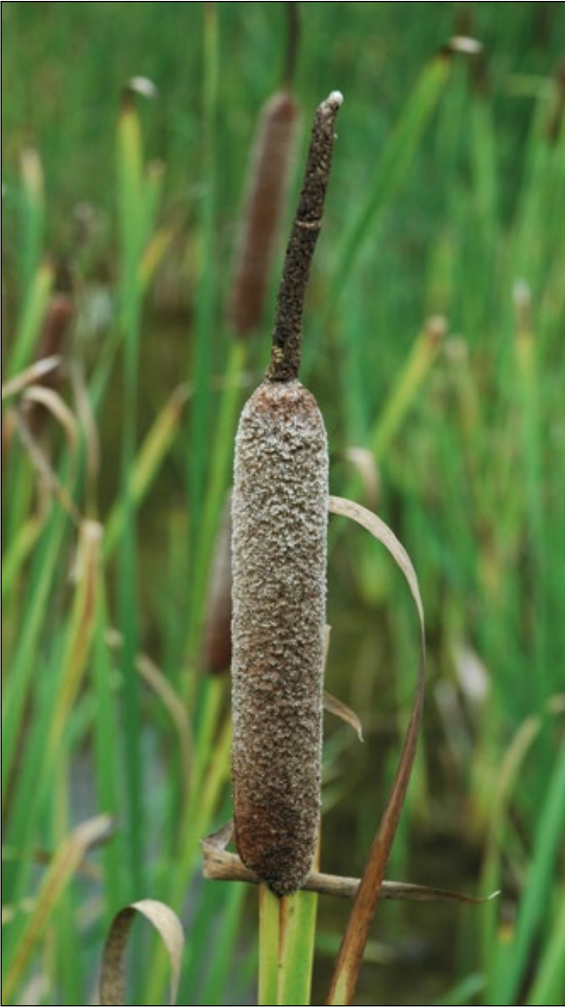
Abb. 12: Der Silber-Rohrkolben ( Typha shuttleworthii ) ist eine seltene Art Oberösterreichs, die hierzulande fast nur in ruderalen Feuchtlebensräumen vorkommt – hier in einer alten Schottergrube bei Manhartsberg/Peterskirchen.