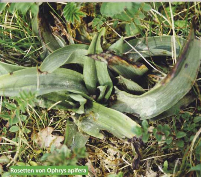
Rosetten von Ophrys apifera