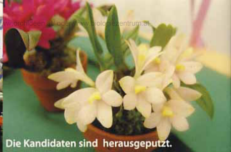
Die Kandidaten sind herausgeputzt.