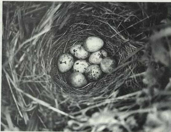
Abb. 1: Doppelgelege der Graumammer, Peetzig/UM, 12.6.98. Fig. 1: Parasitized Corn Bunting clutch, Peetzig/UM, 12.6.98.