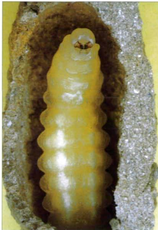
Abb. 3: Die erwachsene Larve von Sceliphron curvatum hat sämtliche eingetragenen Spinnen gefressen (Ventralansicht)

Zur Nahrungsaufnahme beißt sich die Junglarve an der Ventralseite des Opisthosomas nahe der Stigmen fest. Im halberwachsenen Zustand beißt sich die Wespenmade mit ihrer Kopfkapsel tief in den Spinnenleib hinein, wobei am Kopf ständig leicht zuckende Pumpbewegungen zu erkennen sind, die sich über den ganzen Körper peristaltisch bis zum Hinterleibsende fortsetzen. Sowohl die kleinen wie auch die größeren Junglarven sind relativ leicht von ihren Spinnen zu trennen. An der erwachsenen ersten Larve ist die Kopfkapsel in ihrer Färbung kaum noch vom Larvenkörper abzugrenzen. An der Junglarve ist lateral eine Reihe hellgelber, halbkugelförmiger Wülste vorhanden (je Segment eine Erhebung).