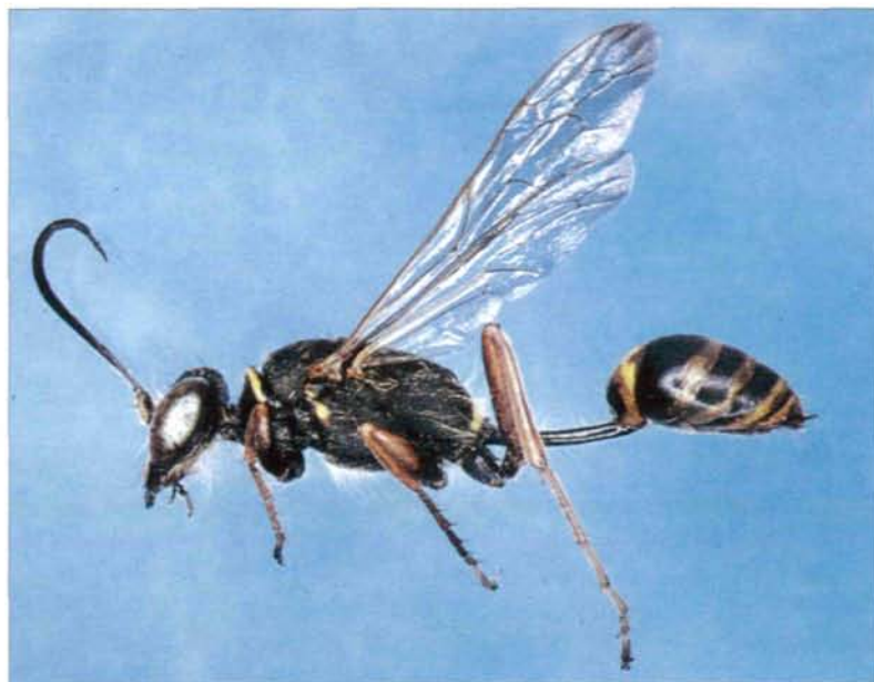
Abb. 1: Die Orientalische Mauerwespe, Sceliphron curvatum (SMITH 1870), mißt in der natürlichen Länge 16-20 mm.

Die bisherigen Kenntnisse zur Biologie von S. curvatum in Europa fußen auf Beobachtungen der eher regionalen Ansiedlungsversuche im Südwesten der Steiermark (GEPP & BREGANT 1986). Die nahezu explosionsartige Ausweitung des Areal (vgl. Kap. 8) und die Vervielfachung der Beobachtungen erbrachten weitere Details zur Biologie und zum Verhaltensspektrum.