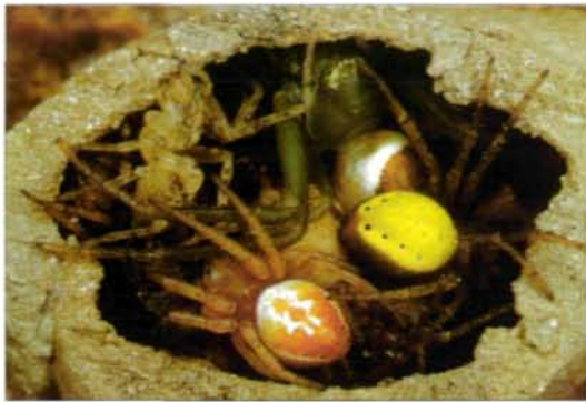
Abb. 5: Vom Untergrund abgelöste Lehmzelle mit Einsicht auf die eingesammelten und gelähmten Spinnen im Inneren.