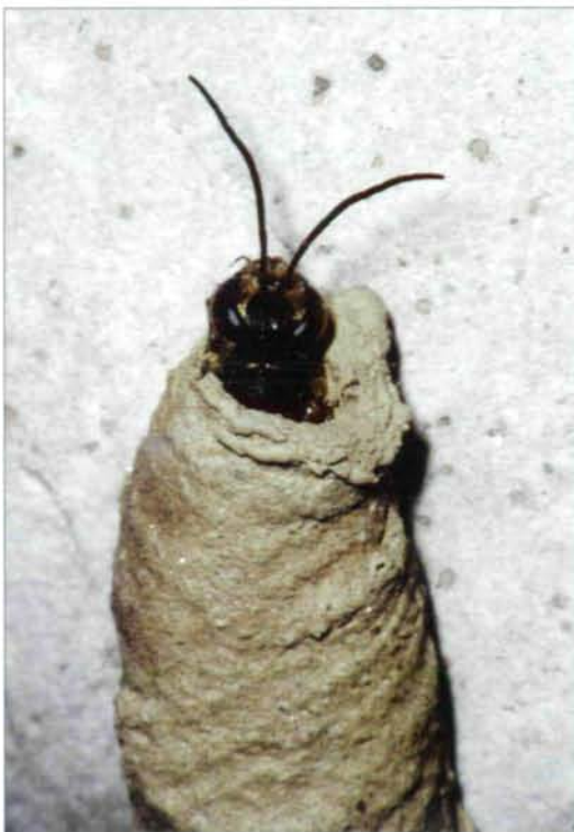
Abb. 4: Aus einer Lehmzelle frisch schlüpfende Imago von Sceliphron curvatum .

Die erwachsene Larve von Sceliphron curvatum ist insgesamt weiß bis hellgelb gefärbt. Ihre Kopfkapsel ist blaßgelb, wobei an der Stirn zwei hellgraue und zwei hellbraune Streifen erkennbar sind; die Mundwerkzeuge sind zum Teil hellbraun, zum Teil dunkelbraun (Mandibeln) und deutlich erkennbar. Die erwachsene Larve füllt die Lehmzelle in ihrer Länge nahezu völlig aus (Abb. 3).