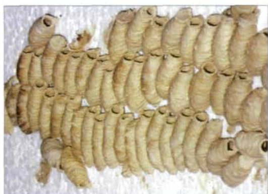
Abb. 2: Serie von Lehmtöpfen deponiert auf weißem Porzellan im Bereich des Dachbodens eines Wohnhauses.