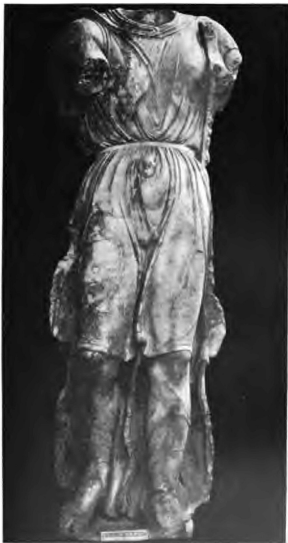
Giebelstatue Glyptothek Ny Carlsberg, Kopenhagen.