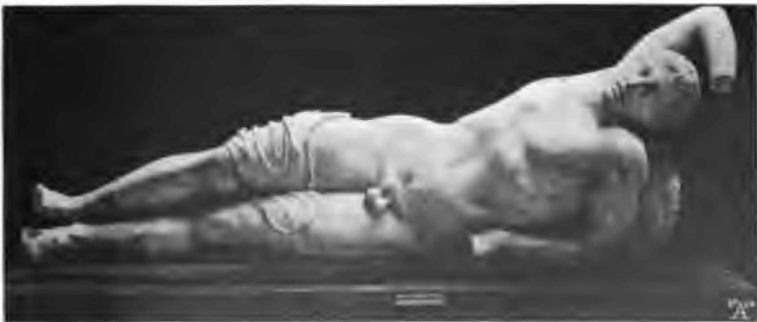
Giebelstatuen Glyptothek Ny Carlsberg, Kopenhagen.