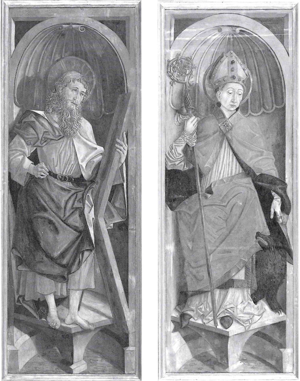
Abb. 2a/b: Friedrich Pacher und Werkstatt, Hll. Andreas und Korbinian (Flügelaußenseiten), Stedelijk Museum Zutphen