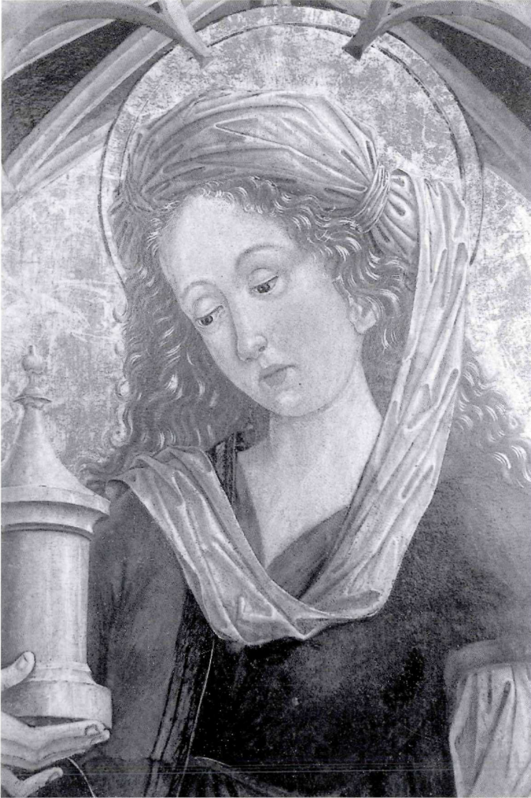
Abb. 5: Friedrich Pacher, Hl. Maria Magdalena (Detail), Stedelijk Museum Zutphen

rangierten Mantel unterstrichen werden, doch kommt es auf der linken Körperseite zu merkwürdigen Stauchungen. Sollten Vorbilder aus dem Kreis der Vivarini eine Rolle spielen, wie Herzig annimmt, so scheint die Adaption nicht recht gelungen. Das Vierschrötige der Erscheinung wird schließlich unterstützt durch die derbere Bildung des Gesichtes, die am ehesten auf die späteren Vorlieben des Barbaremeisters hindeuten könnte.