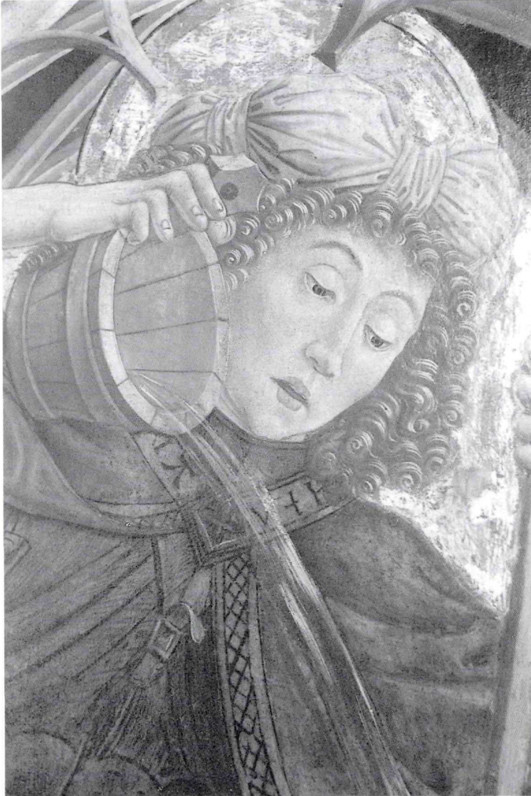
Abb. 4: Friedrich Pacher, Hl. Florian (Detail), Stedelijk Museum Zutphen

tal oder denjenigen von St. Korbinian denken 26 . Paulus ist dagegen stämmiger und robuster und scheint aus seiner Nische hervorzudrängen. Das breitbeinige Stehen soll durch den „all’antica“ ar-