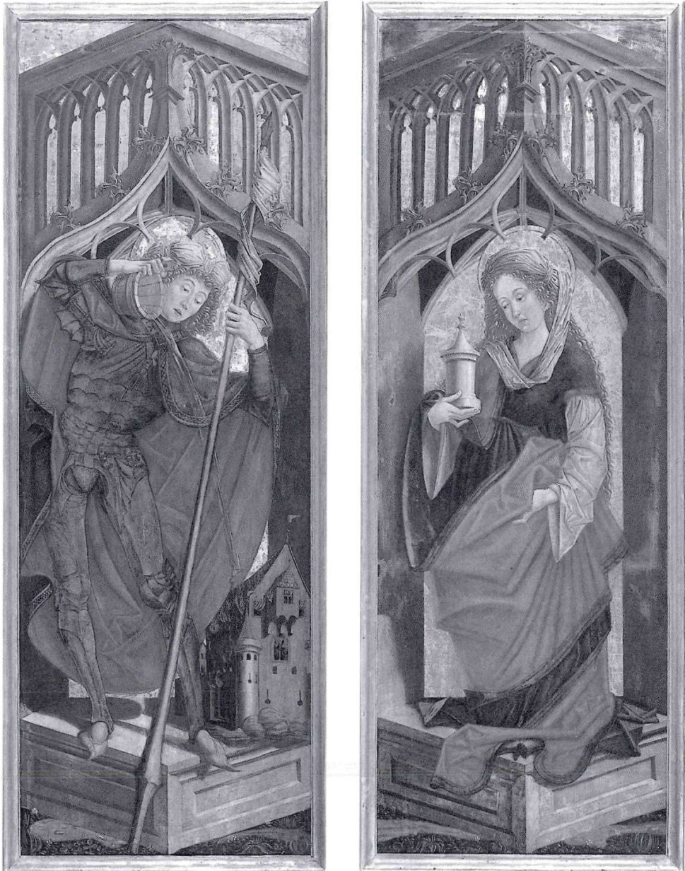
Abb. 2 c/d: Friedrich Pacher: III. Florian und Maria Magdalena (Flügelinnenseiten), Stedelijk Museum Zutphen