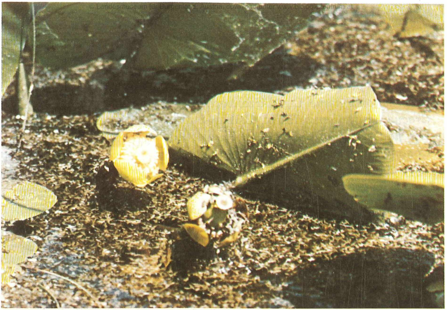
Gelbe Teichrose ( Nuphar luteum ) bei Glasing