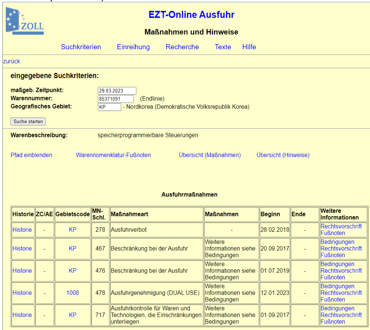
Abbildung 4 (Fortsetzung)