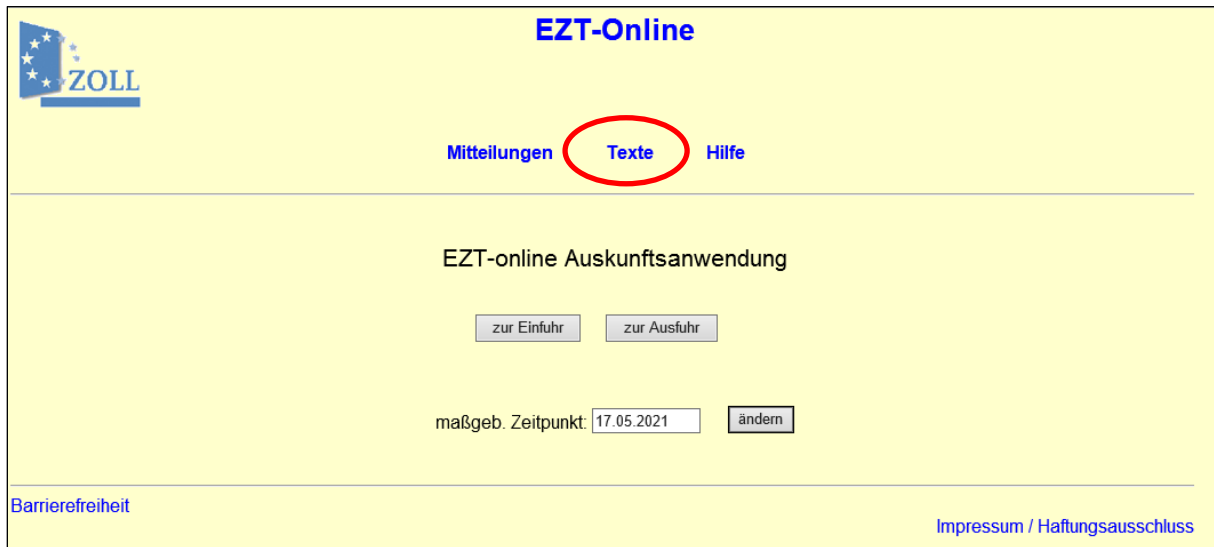
Abbildung 9: EZT-Online Texte (Verlinkung)

Alternativ lässt sich der Bereich Texte auch über die Bereiche EZT-Online Einfuhr oder EZT-Online Ausfuhr aufrufen. Bei einem Aufruf auf diese Weise besteht ergänzend die Möglichkeit, über das Feld „Suche“ innerhalb ausgewählter Texte anhand von Suchbegriffen zu recherchieren.