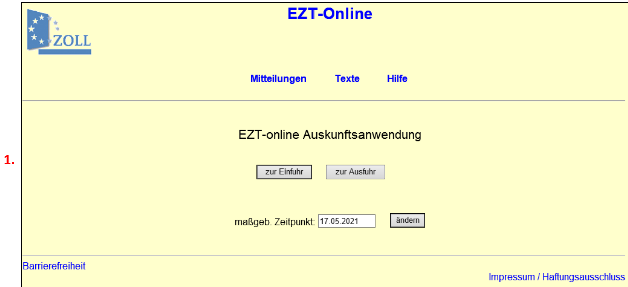
Abbildung 2: Startseite EZT-Online