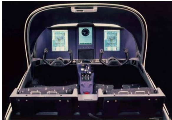
Kleinflugzeugsimulator GROB G115