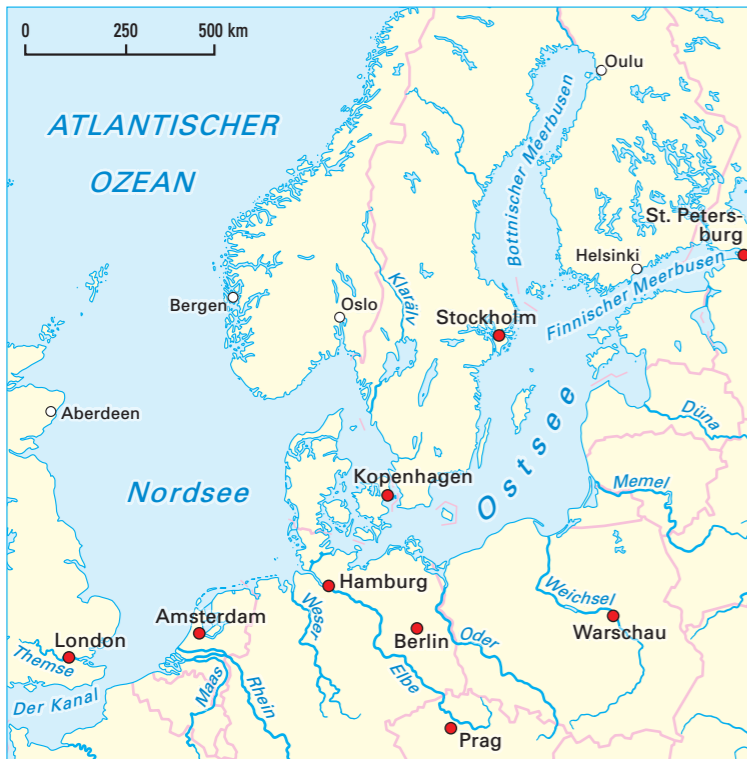
1 Randmeer Nordsee und Binnenmeer Ostsee