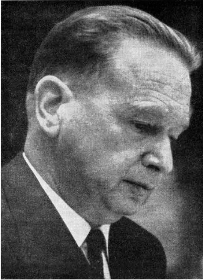
Dag Hammarskjöld, Verfasser der »Zeichen am Weg« (siehe den Beitrag auf S. 201 ff.).

sondern Gott in mir« (84). Er weiß um seine »Reife«, um jene übernatürliche Umformung, die »eine neue Unbewußtheit« und »Freiheit« schenkt, wenn einer »sich Gott überlassen hat« (84). Am 7. April 1953 erfolgte die amtliche Berufung zum Generalsekretär der Vereinten Nationen. An diesem Tag notiert er aus einem französischen, auch später öfters zitierten geistlichen Buch (der Sprachstand entspricht ungefähr dem des 17. Jahrhunderts) über die Verhaltensweise der Männer Gottes. »In Gott sind sie verankert und gefestigt; darum überheben sie sich nicht in leerem Wahn. Weil sie alles Gute, das sie empfangen haben, Gott allein zuschreiben, nehmen sie keine Ehre voneinander, sondern ersehnen allein die Ehre Gottes« (84). Die nächste Eintragung: »Ich bin das Gefäß. Gottes ist das Getränk. Und Gott der Dürstende.« »Daß der Weg der Berufung auf dem Kreuz endet, weiß, wer sich seinem Schicksal unterstellt hat« (84). Das Wort »Opfer«, das einst der jugendliche Hammarskjöld gebrauchte, hat seinen pathetischen Klang verloren. Ein anderes Wissen hat sich durchgesetzt. »Was hat am Ende das Wort Opfer für einen Sinn? Oder auch nur das Wort Gabe? Wer nichts hat, kann nichts geben. Die Gabe ist Gottes – an Gott« (86).