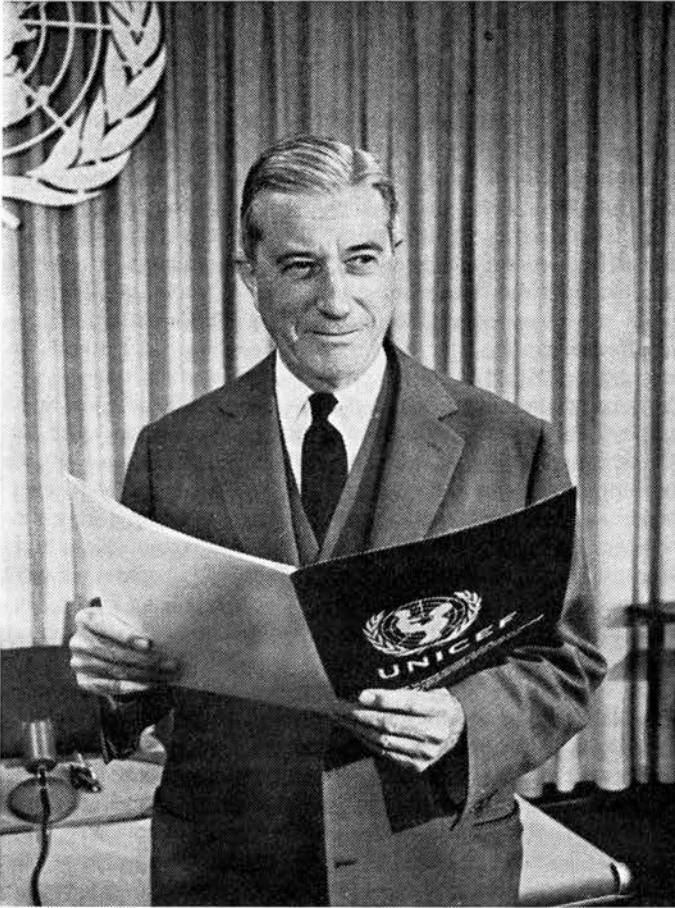
Den diesjährigen Friedensnobelpreis erhielt das Weltkinderhilfswerk der Vereinten Nationen. Das Bild zeigt seinen jetzigen Leiter, Henry R. Labouisse (vgl. VN Heft 5/65 S. 178 f.).

liegt, wie U Thant dem Rat in dem ersten seiner beiden Berichte über seine Friedensmission mitteilte, in Äußerungen Indiens und Pakistans, die sich »im Prinzip« für einen Waffenstillstand und für eine Wiederherstellung der Lage vor dem 5. August aussprachen. Aber in den Antworten sowohl des indischen Ministerpräsidenten wie des pakistanischen Präsidenten waren bereits die Vorbehalte deutlich sichtbar, die ihre Haltung zum ganzen Problem charakterisierten: Pakistan stellte eine nach Meinung des Generalsekretärs unlösbare Verbindung zwischen Waffenstillstand einerseits und der Lösung des zugrunde liegenden Gesamtproblems, nämlich der Lösung des Kaschmir-Problems durch eine Volksabstimmung, andererseits her. Und Indien vertrat schon jetzt den Standpunkt, daß ein Waffenstillstand und die Wiederherstellung der Ruhe nur dann Sinn hätte, wenn Pakistan Garantien gäbe, daß es Infiltrationen Kaschmirs durch bewaffnete Freischärler und andere Versuche, einen Aufstand in Kaschmir herbeizuführen, zukünftig unterlassen und den seit 1949 bestehenden Zustand respektieren würde; Indien hielt auch an dem seit einigen Jahren von ihm immer wieder betonten Grundsatz fest, daß Jammu und Kaschmir Teile der indischen Union geworden seien, von der sie nicht losgelöst werden könnten.