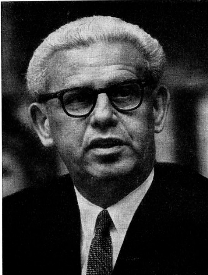
Arthur J. Goldberg, der jetzige Chefdelegierte der USA bei den Vereinten Nationen.

gebe auch begrenzte Kernwaffen. Es sei ungerecht, alle Regierungen zu verurteilen, auch solche, die sich einem ungerichten Angriff ausgesetzt sähen. Ferner bestehe die Pflicht der Staaten zur Verteidigung der Freiheit 8 .